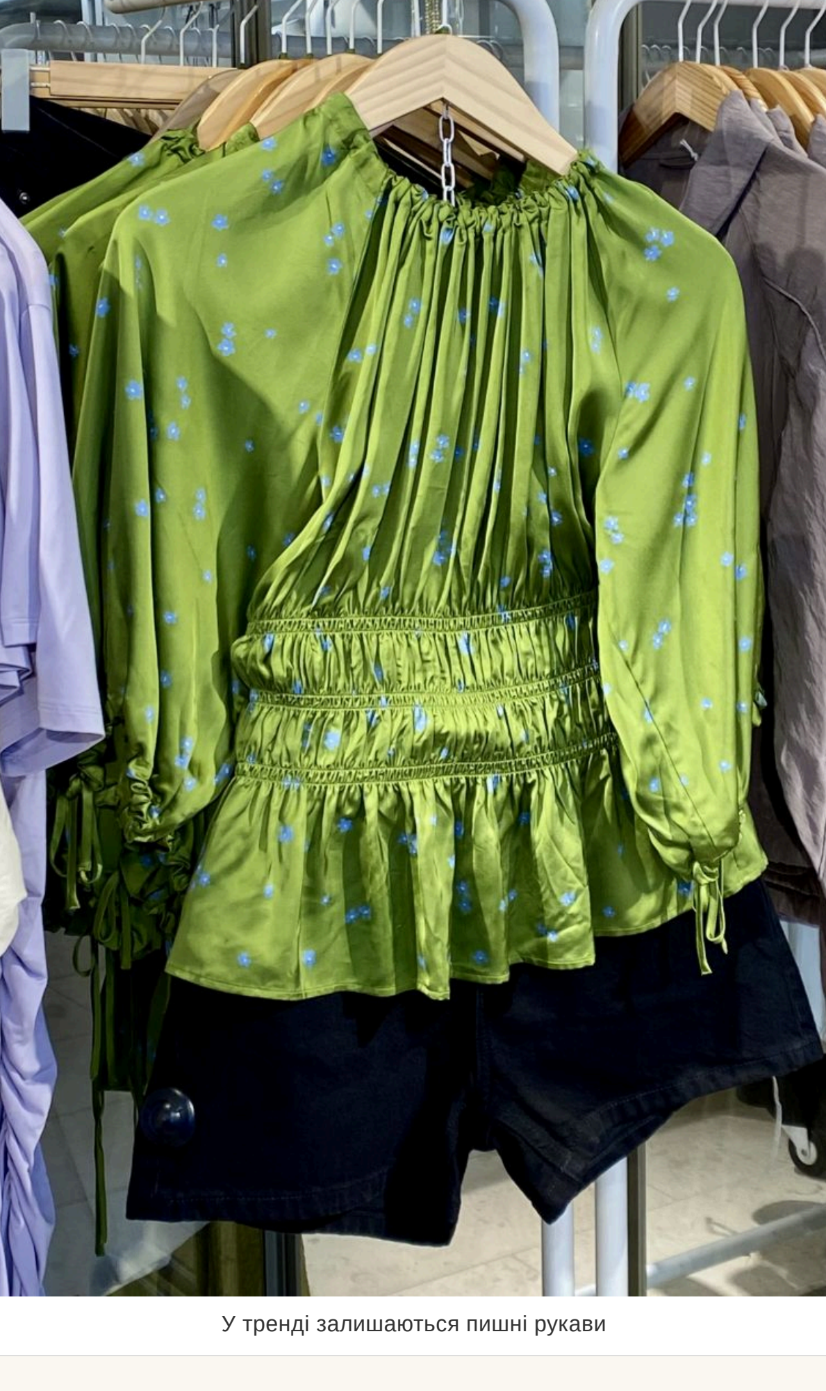
У тренді залишаються пишні рукави

— Зрозуміло, що всляжких шарфіків, хусток, шалок у кожної з нас у шафі накопичилося безліч. Але принесіть собі задоволення, купіть янкіну шовкову хустку. Вона не зрадить вам навіть через багато років. Якщо хочеться ще якийсь аксесуар, зупиніться на «черепашці» для волосся. Це зовсім недорога покупка, яка може на якийсь час підняти вам настрій і буде спокійно забута наступного сезону.