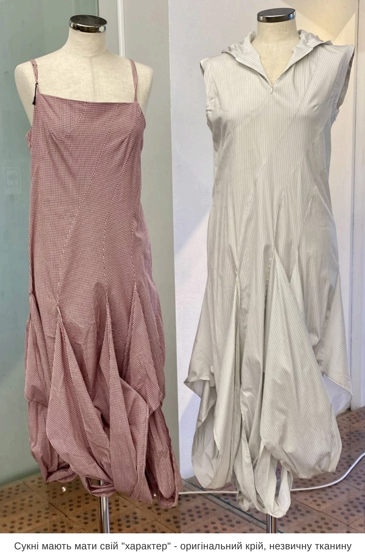
Сукні мають мати свій «характер» - оригінальний крої, незвичну тканину чи особливий колір

— Вже який сезон літо не обходиться без легких суконь та сарафанів. У тренді залишаються пишні рукави, а от волани вже практично зникли. На зміну їм прийшло дофудування та асиметрія. Взагалі, цього сезону має бути, як то кажуть, «з характером». Її особливість може виявитися в оригінальному крої, незвичайній тканині або її кольорах. Пов'язьте на талію ту ж шовкову хустку чи сорочку — і вже буде оригінальний вигляд. Мода перестас бути безликою, вона віддає перевагу індивідуальності та оригінальності.