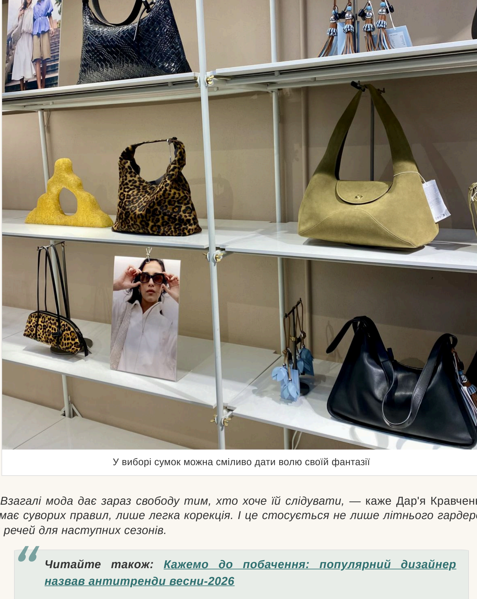
У виборі сумок можна сміливо дати волю своїй фантазії

— Тут можете давати волю своїй фантазії та перевагам. Носіть об'ємні шкряпані шопери та невеликі сумочки, в які можна покласти лише найнеобхідніше. На щастя, мода на мініатюрні екземпляри вже пройшла — більш непрактичного аксесуара складно уявити.