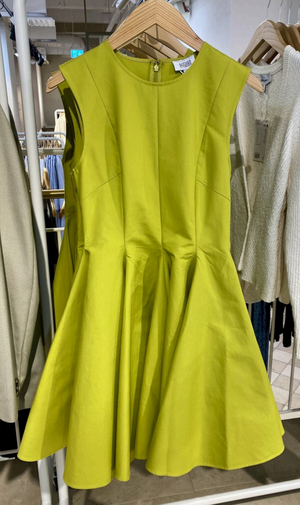
В тренді зелений колір

— Гарно — від маленького до великого. Квіткові принти, але без надмірних малюнків, найкраще зрізні квіточки. Про картату тканину можна забути до осені, а от смужка залишається актуальною. «Тваринні» принти ще утримуються в моді. Але «парадом» командує яскраво-зелений колір. За ним «прокують» червоний, коричневий та синій. Знову в моді спідниці-балони, а ось плісування, яке було актуальне ще минулого сезону — на якийсь час забуто.