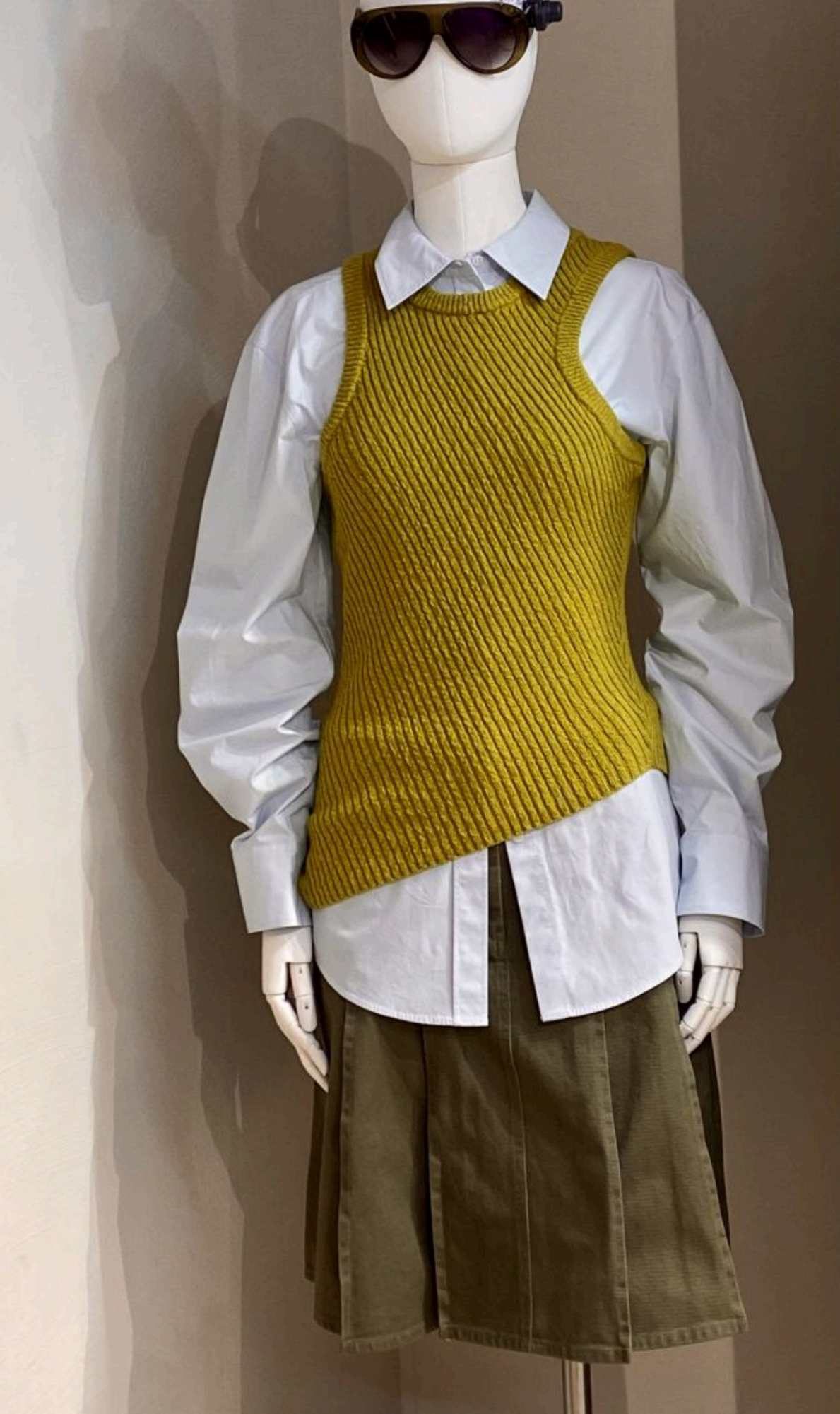
Асиметрія в одязі знову на піку популярності

— Як бальетки та сумки із заклепками. Минулого літа вони були на піку популярності та коштували пристойні гроші. Але, на відміну від класичних одностопних бальеток, мода на «прикраси» дуже швидко пройшла. Як і «божевілья» з приводу всляжких брелоків на сумках. Так, відміння цього тренду перейшли у весняний сезон, але дуже швидко йдуть на спад. Тому знатися за милльєвими забаганки моди не варто.