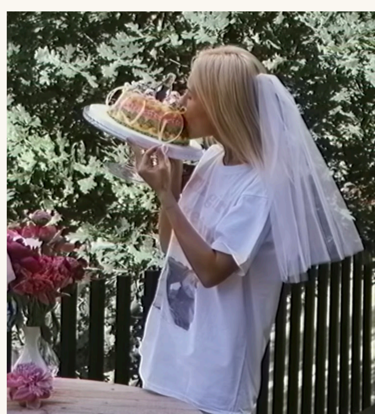
Даша з найближчими подругами

«В епоху, коли я була нареченою», — підписала світлини та відео Даша.