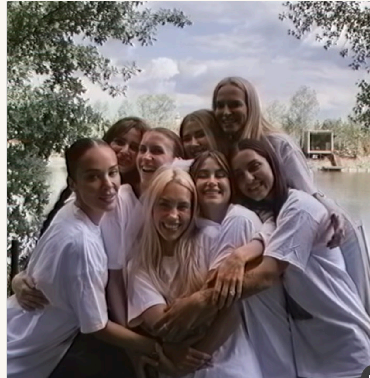
Даша з найближчими подругами

У мережі підписники поділилися враженнями та зауважили, наскільки душевно та просто пройшла вечірка відомої блогерки.