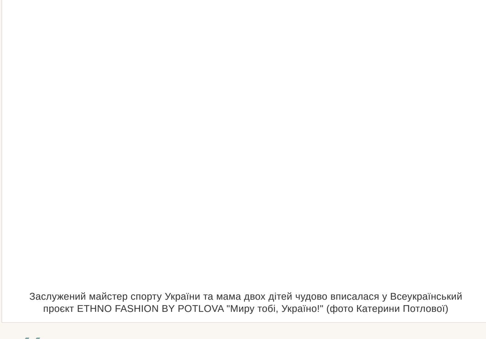
Заслужений майстер спорту України та мама двох дітей чудово впісалася у Всеукраїнський проєкт ETNHO FASHION BY POTLOVA "Миру тобі, Україно!"

— Ми вже п'ять років розлучені. Просто обговорюю цей факт тільки зараз. Є відчуття, що життя подарує ще одну казку. Адже одна вже була. Я живу з гармонією в собі і відкриття для світу. І відкрита для нового кохання. А, ви маєте на увазі, чи переживала я п'ять років тому. Звичайно. Спочатку. А потім стала жартувати над собою: «Стоп! Свето, але ж ти хотіла, щоб у тебе все було, як у здорових людей. І ось тепер у тебе все, як у людей: і шлюб, і діти, і розлучення...»