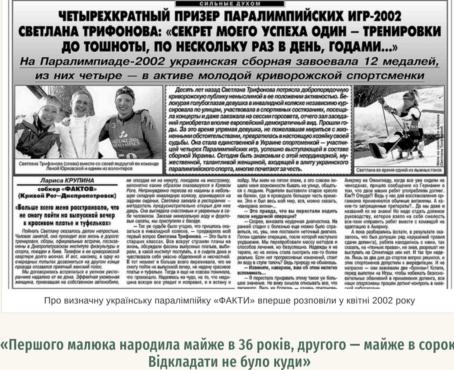
Про визнання українську паралімпію «ФАКТИ» вперше розповіли у квітні 2002 року