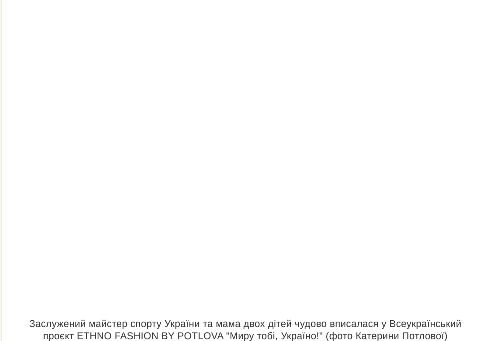
Заслужений майстер спорту України та мама двох дітей чудово впиласяся у Всеукраїнський проєкт ETHNO FASHION BY POTLOVA "Миру тобі, Україно!"

— Ми вже п'ять років розлучені. Просто обговорюю цей факт тільки зараз. Є відчуття, що життя подібує ще одну казку. Адже одна вже була. Я живу з гармонією в собі і відкрита для світу. І відкрита для нового кохання. А, ви маєте на увазі, чи переживала я п'ять років тому. Звичайно. Спочатку. А потім стала жартувати над собою: «Стоп! Свето, але ж ти хотіла, щоб у тебе все було, як у здорових людей. І ось тепер у тебе все, як у людей: і шлюб, і діти, і розлучення...»