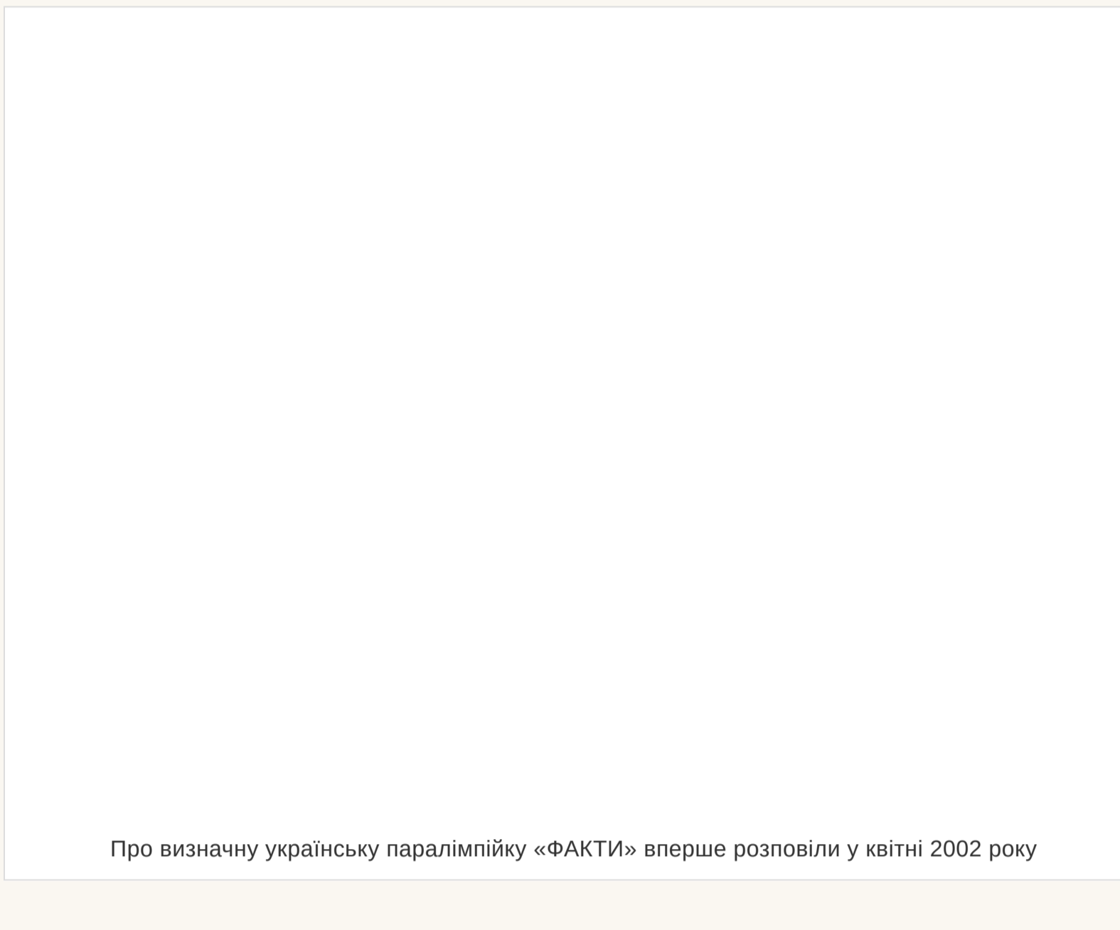
Про визначну українську паралімпійку «ФАКТИ» вперше розповіли у квітні 2002 року