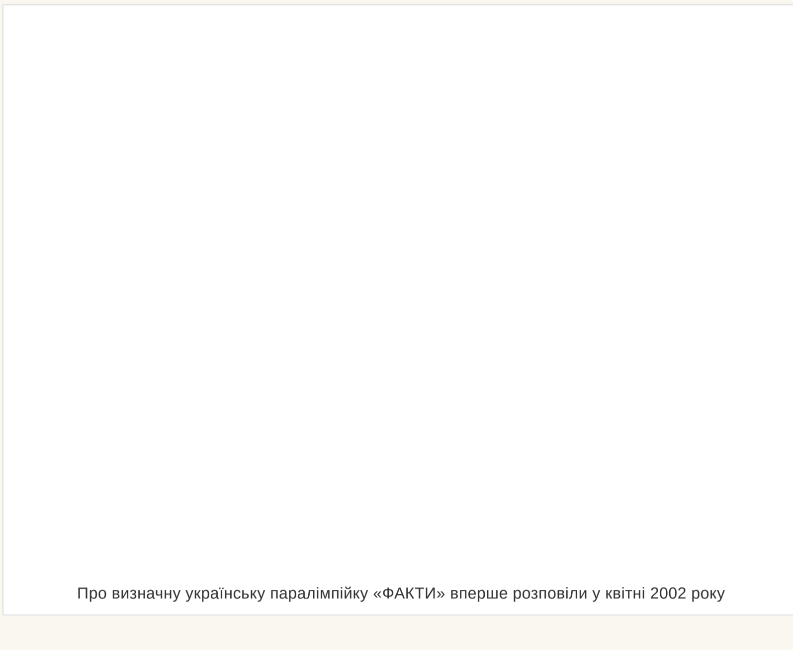
Про визначену українську паралімпійку «ФАКТИ» вперше розповіли у квітні 2002 року