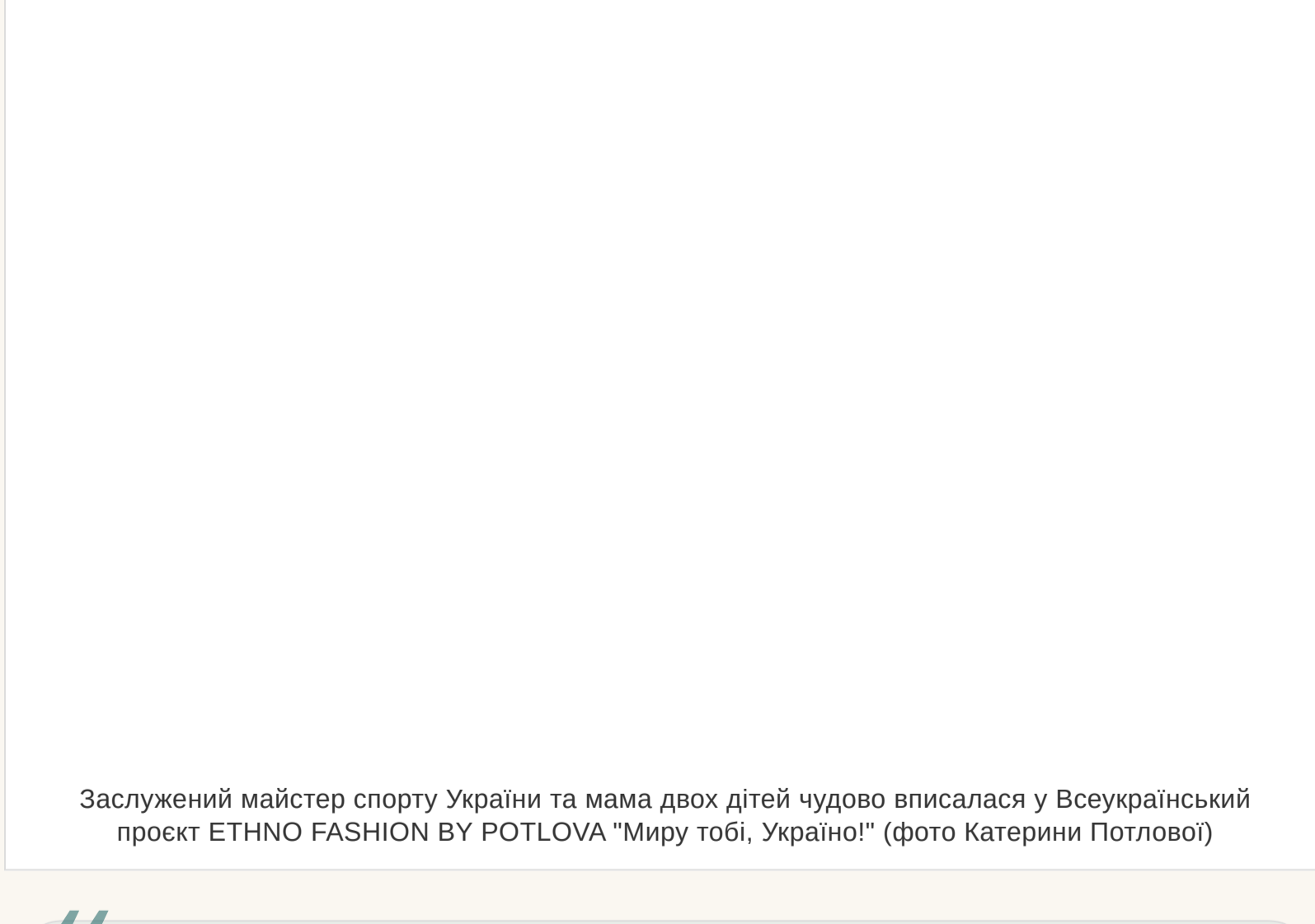
Заслужений майстер спорту України та мама двох дітей чудово впісалася у Всеукраїнський проєкт ETHNO FASHION BY POTLOVA "Миру тобі, Україно!"

— Ми вже п'ять років розлучені. Просто обговорюю цей факт тільки зараз. Є відчуття, що життя подає ще одну казку. Адже одна вже була. Я живу з зарплаткою в собі і відкрита для світу. І відкрита для нового кохання. А, ви маєте на увазі, чи переживала я п'ять років тому. Звичайно. Спочатку. А потім стала жартувати над собою: «Стоп! Свето, але ж ти хотіла, щоб у тебе все було, як у здорових людей. І ось тепер у тебе все, як у людей: і шлюб, і діти, і розлучення...»