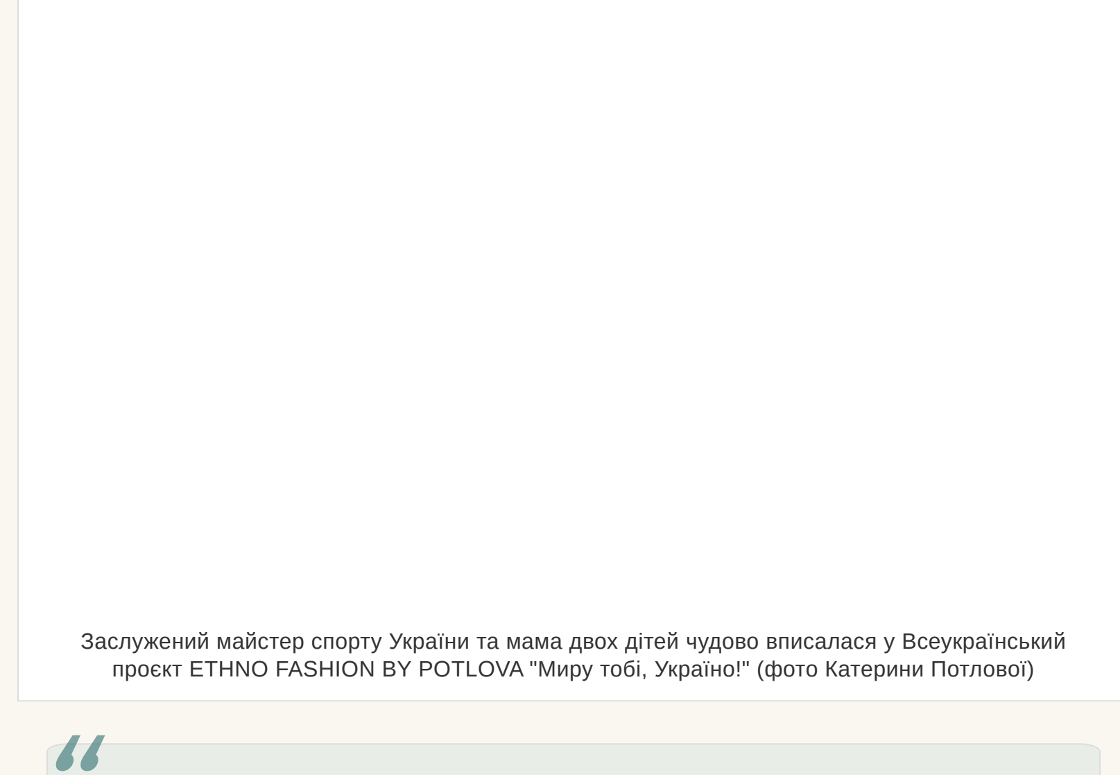
Заслужений майстер спорту України та мама двоох дітей чудово вписалася у Всеукраїнський проєкт ETHNO FASHION BY POTLOVA «Мирю тобі, Україно!»

— Ми вже п'ять років розлучені. Просто обговорюю цей факт тільки зараз. Є відчуття, що життя подарує ще одну казку. Адже одна вже була. Я живу з гармонією в собі і відкриття для світу. І відкрита для нового кохання. А, ви маєте на увазі, чи переживала я п'ять років тому. Звичайно. Спочатку. А потім стала жартувати над собою: «Стоп! Свето, але ж ти хотіла, щоб у тебе все було, як у здорових людей. І ось тепер: у тебе все, як у людей: і шлюб, і діти, і розлучення...»