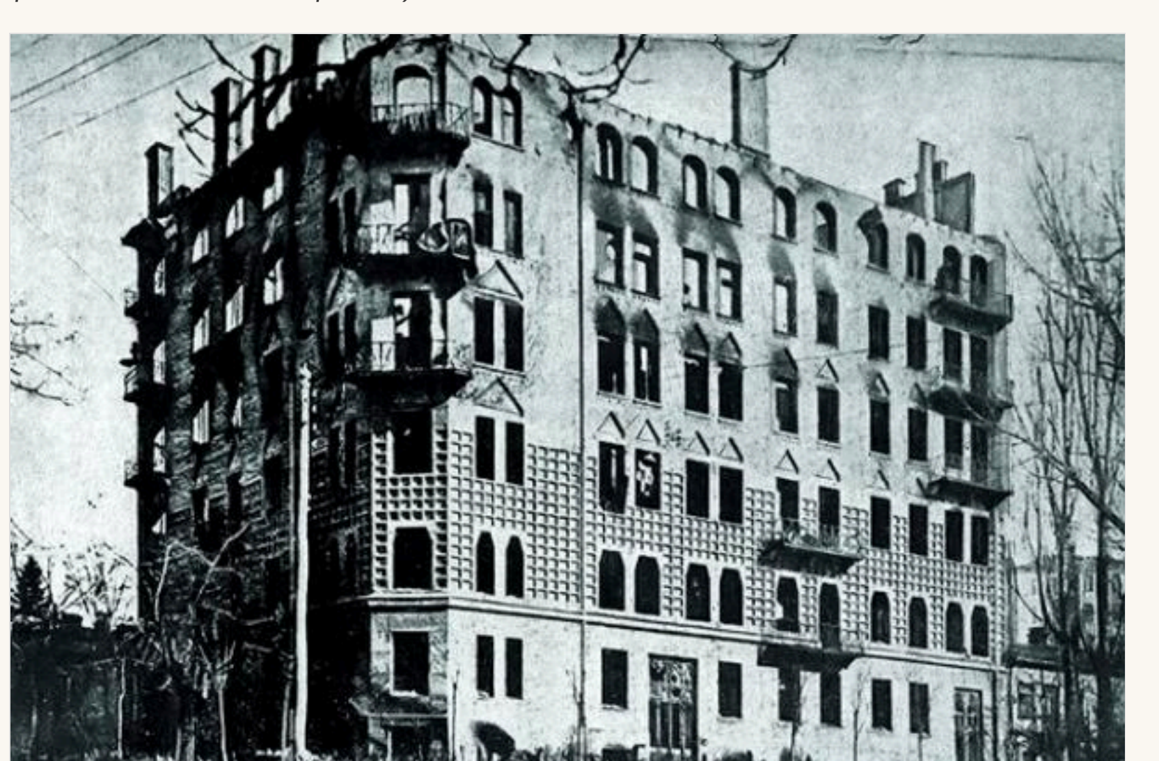
Будинок Грушевського палав три дні і повністю вигорів

— Зберелась відомості про те, що за декілька днів солдати Муравйова випустили з Дарниці по Києву понад 5 тисяч снарядів! — розповів «ФАКТМ» Віталій Штефан. — Зважте на те, що Київ тоді був на багатому меншим, ніж зараз. Не на надто великій густонаселеній території розкидалось така величезна кількість снарядів! Галили передусім по тим частинкам міста, де мешкали не бідні люди — по центру та Пенерській. Тоді в Києві одним з найвищих (7 поверхів) був приватковий будинок очільника Української Центральної Ради Михайла Грушевського (там здавались квартири, Грушевський також жив в цьому домі). Більшовики знали, чия це багатоповерхівка і, певно, навмисно били по ній. Муравйов тішився з того, казав, що вона 3 дні палала, мов факел. Будинок повністю згорів. Через декілька днів через пережитий поді дуже сильний стрес померла мама Грушевського Глафіра Захарівна (хоча в офіційному свідоцтві в рядку «причина смерті» записали «від старості»).