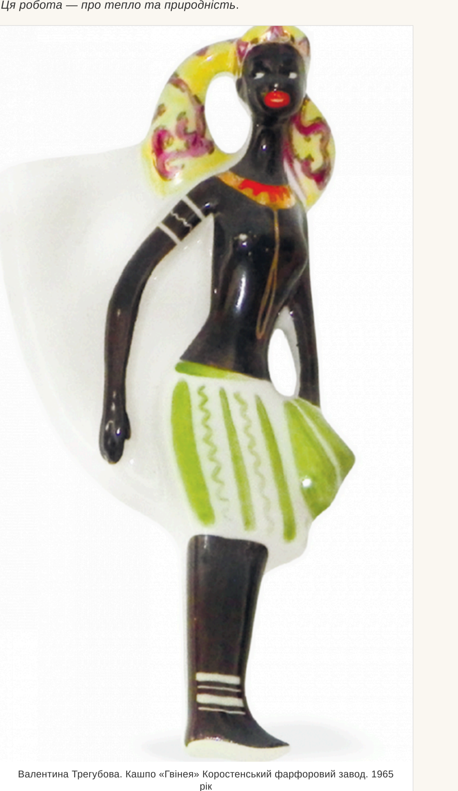
Валентина Трегубова. Кашпо «Гвінея» Коростенський фарфоровий завод, 1965 рік

— Так. Ось, наприклад, «Гвінея». На мою думку, це найтепліший і найбільш «земний» образ у трипти. Постає струнка. Дівчина йде, але не поспішає — у її пластичні є спокій і внутрішня рівновага. Колірна гама завожує. Шоколадний тон шкіри контрастує зі світлим та яскравими орнаментальними акцентами. Це відтінки тропічної природи — зелені лісів та буйна квітіння. Наприклад, у Гвінеї росте чимало видів тропічних орхідей. Зачаровують красою папороть та ліани. У цій країні справжній фруктовий рай: манго, папайя, ананаси, апельсини... Жовта хустка на голові дівчини дарує відчуття сонячного настрою. Ця робота — про тепло та природність.