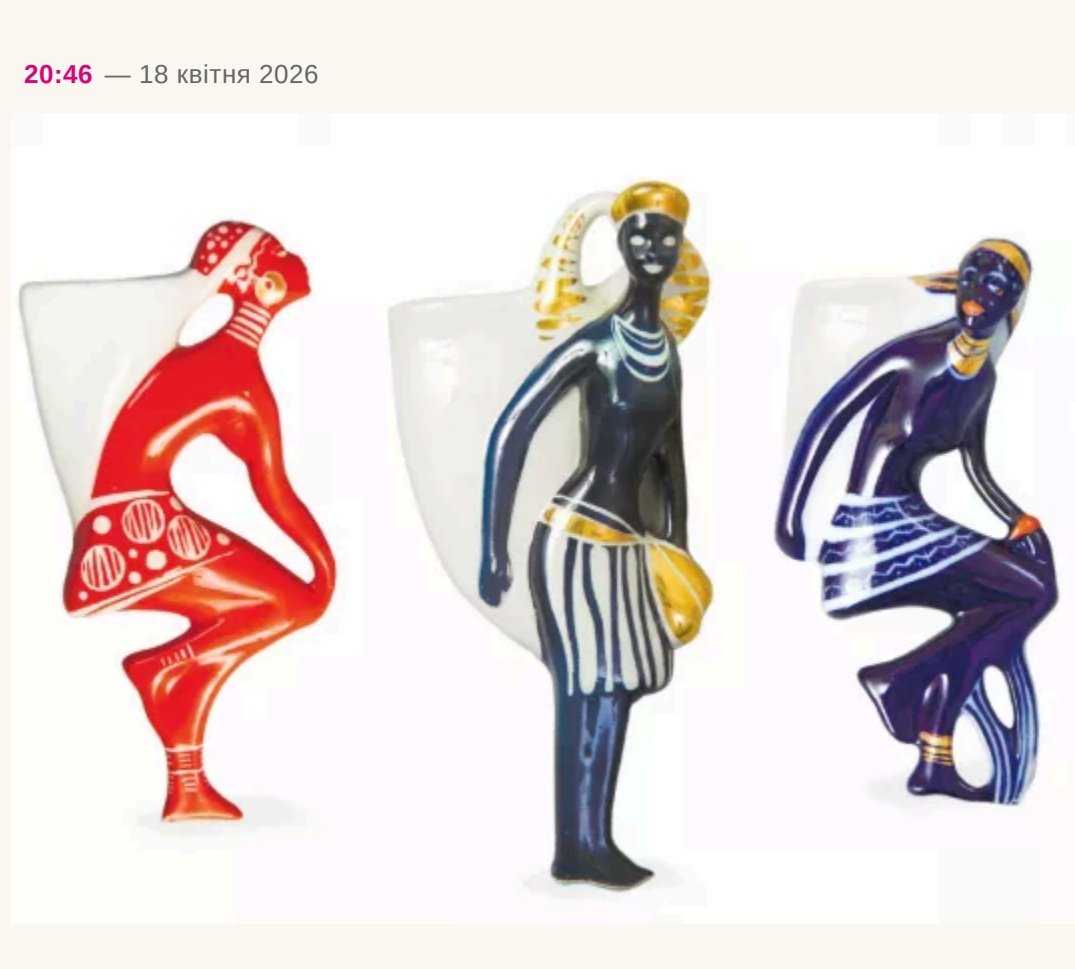
Ольга СМЕТАНСЬКА, «ФАКТИ»

У 1967 році всесвітньо відомий дизайнер Ів Сен Лоран, для якого був створений сорт троянд з ароматом його парфумів, презентував на високому подумі африканську колекцію. Вона викликала резонанс у всьому світі. Африка посідала в житті модельєра особливе місце, адже він народився в Алжирі, а у 1960–70-х роках любив приїздити на виллу у Марракеш, де шукав творчого натхнення. Колекція весна-літо 1968 року вразила паризьких модників сафрляними образами, які з тих пір незмінно затребувані для літнього відпочинку. Африканські мотиви присутні в модних колекціях і багатьох інших всесвітньо відомих дизайнерів.