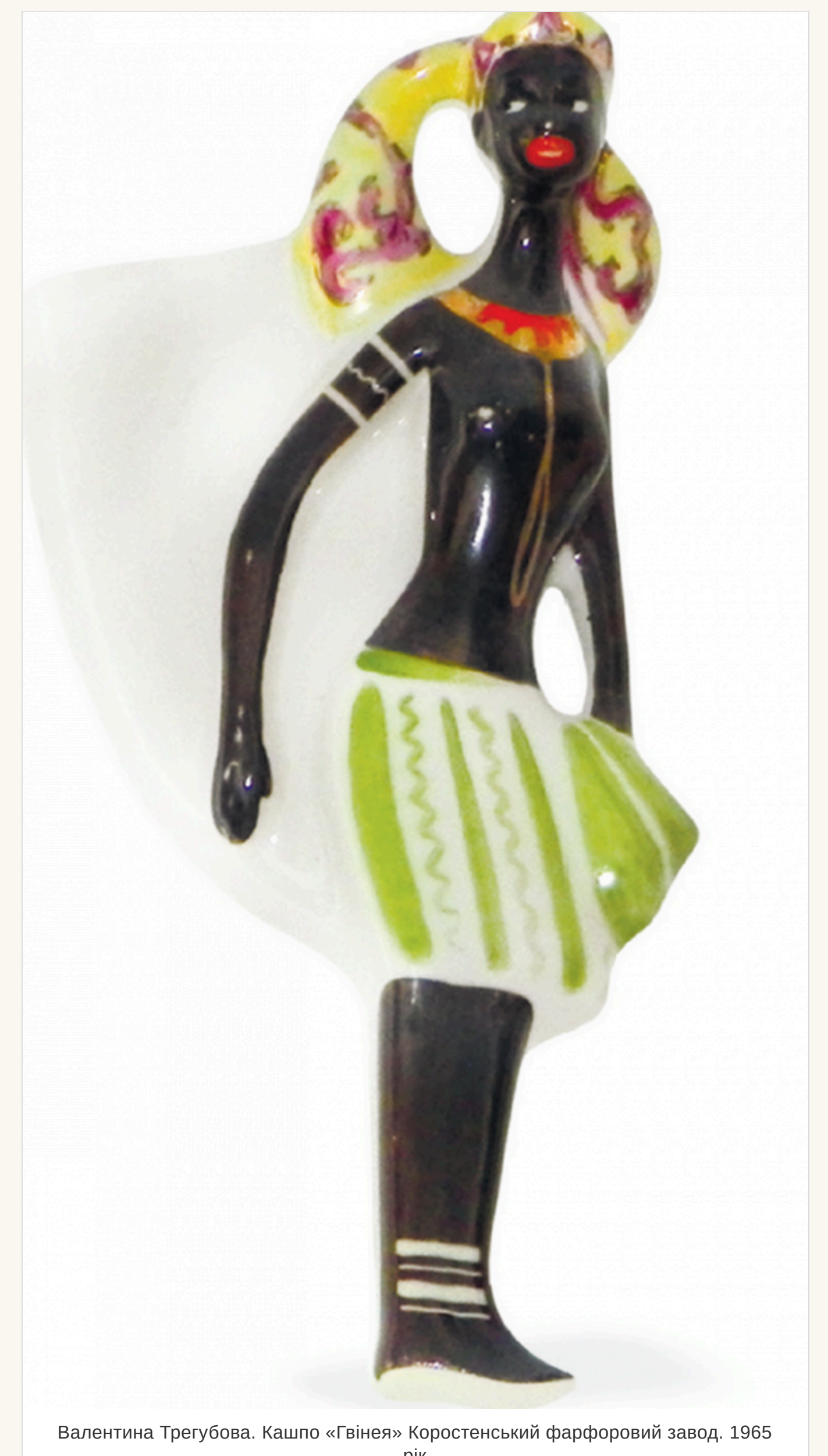
Валентина Трегубова. Кашпо «Гвінея» Коростенський фарфоровий завод, 1965 рік

— Так. Ось, наприклад, «Гвінея». На мою думку, це найтепліший і найбільш «земний» образ у триптих. Постає ступка. Дівчина їде, але не поспішає — у її пластичці є спокій і внутрішня рівновага. Колірна гама заворує. Шоколадний тон шкіри контрастує зі світлим та яскравими орнаментальними акцентами. Це відтінки тропічної природи — зелені ліса та буняні квітви. Наприклад, у Гвінеї росте чимало видів тропічних орхідей. Зачаровують красою папороть та ліани. У цій країні справжній фруктовий рай: манго, папайя, ананаси, апельсини... Жовта хустка на голові дівчини дарує відчуття сонячного настрою. Ця робота — про тепло та природність.