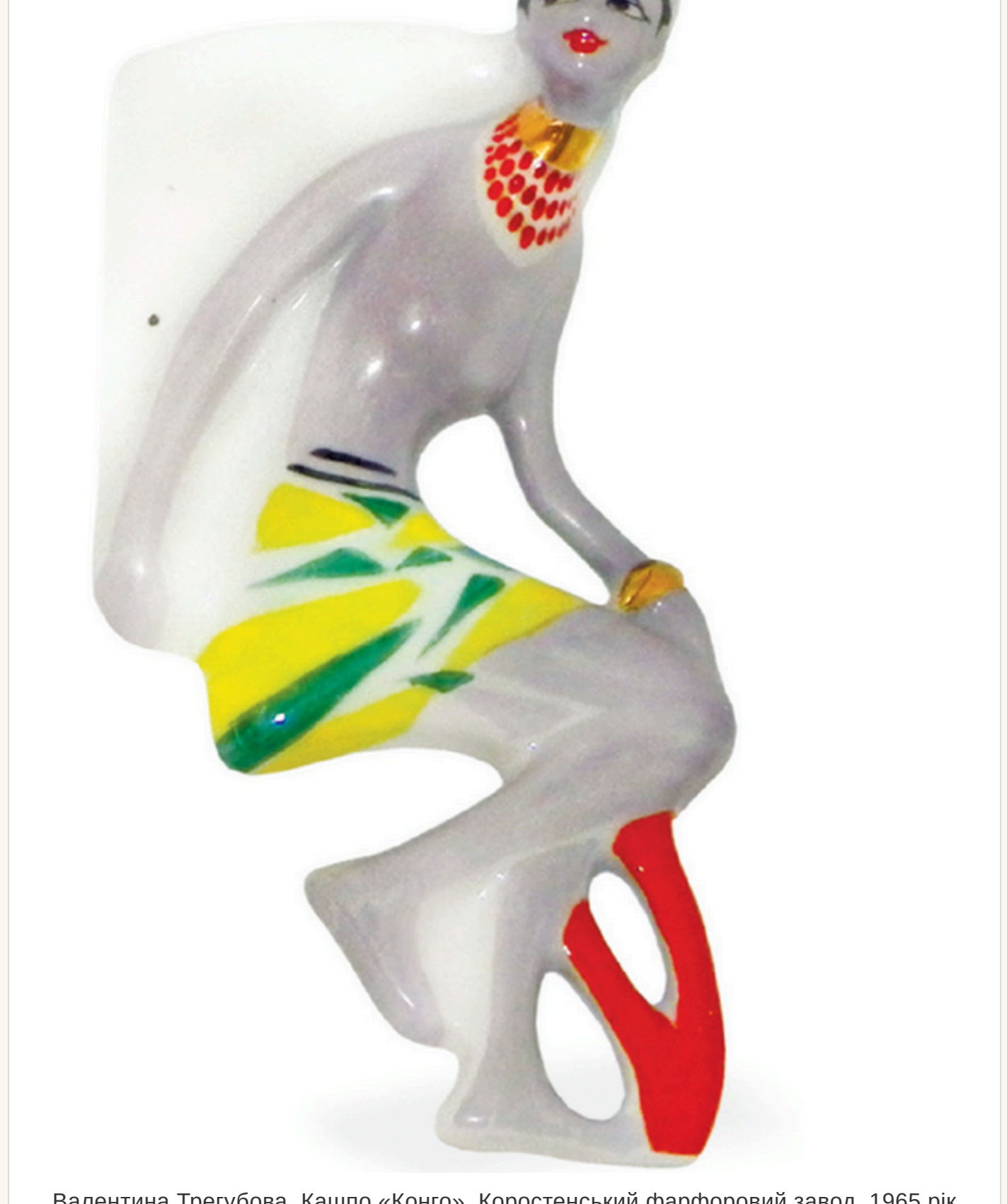
Валентина Трегубова. Кашпо «Конго». Коростенський фарфоровий завод, 1965 рік

— «Конго». Ця фігурка найвитонченіша і водночас найбільш умовна. Ця дівчина не «танцює» і не «їде» — вона ніби пливе. На її шиї — яскраве намисто.