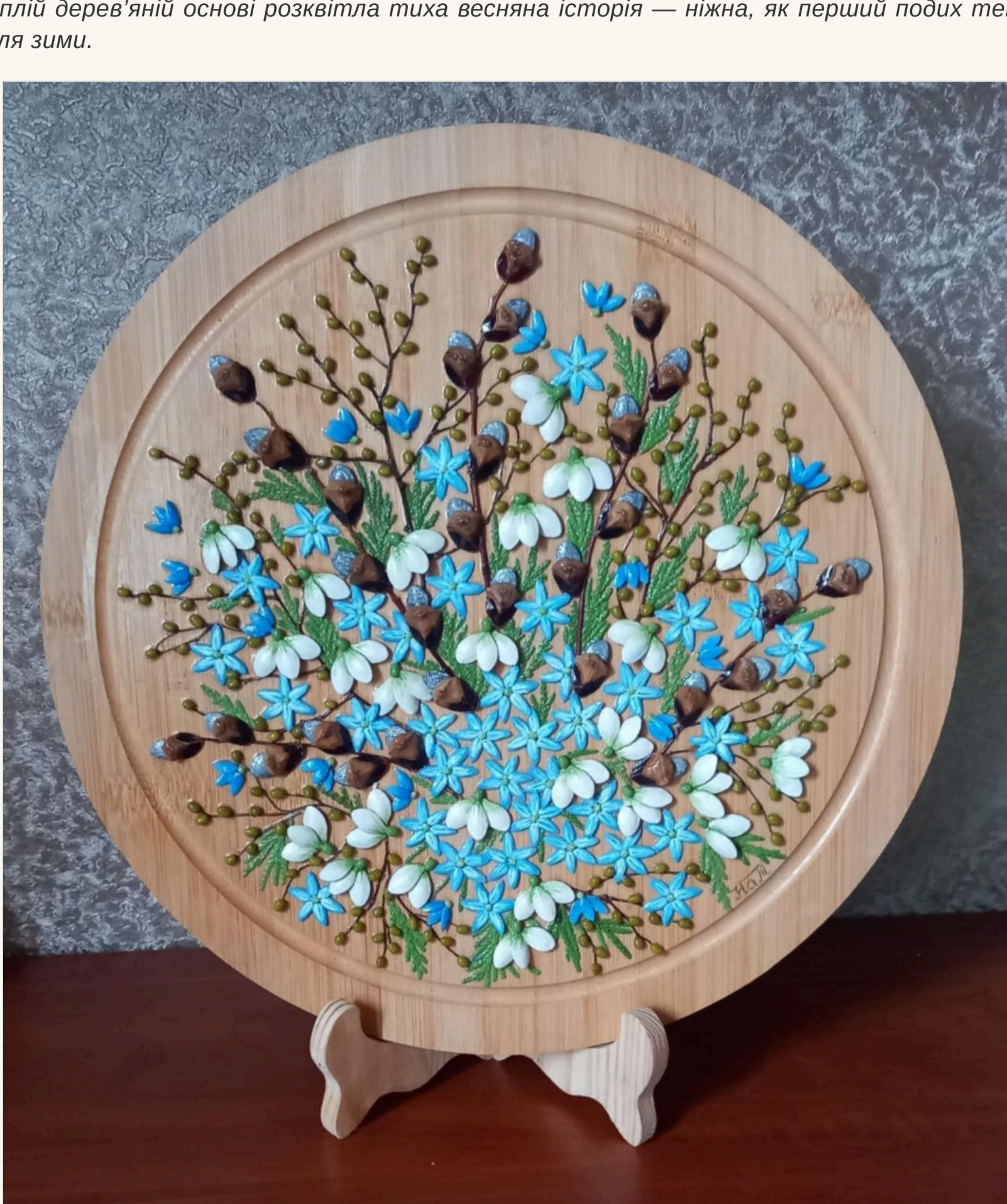
Картина Наталії Тесленко " Весняний подих" – це ода першим квітам, що з'являються після зими

— Поява перших квітів — як весняний подих, який створює відчуття пробудження, несе в душу тепло, віру і надію, — говорить Наталія Тесленко. — Саме так я назвала свою роботу — «Весняний подих». Бажання передати ці почуття через зображення перших вісників весни на картині я плекала років. Як викласти білі дзвіночки підсніжників, що схилиються до землі, зберігаючи в собі чистоту і спокій? Як передати небесний колір пролісків — від темного у пуп'янках до ніжного блакитного — у розкритій квітці? І от на теплій дерев'яній основі розквітла пуха весняна історія — ніжна, як перший подих тепла після зими.