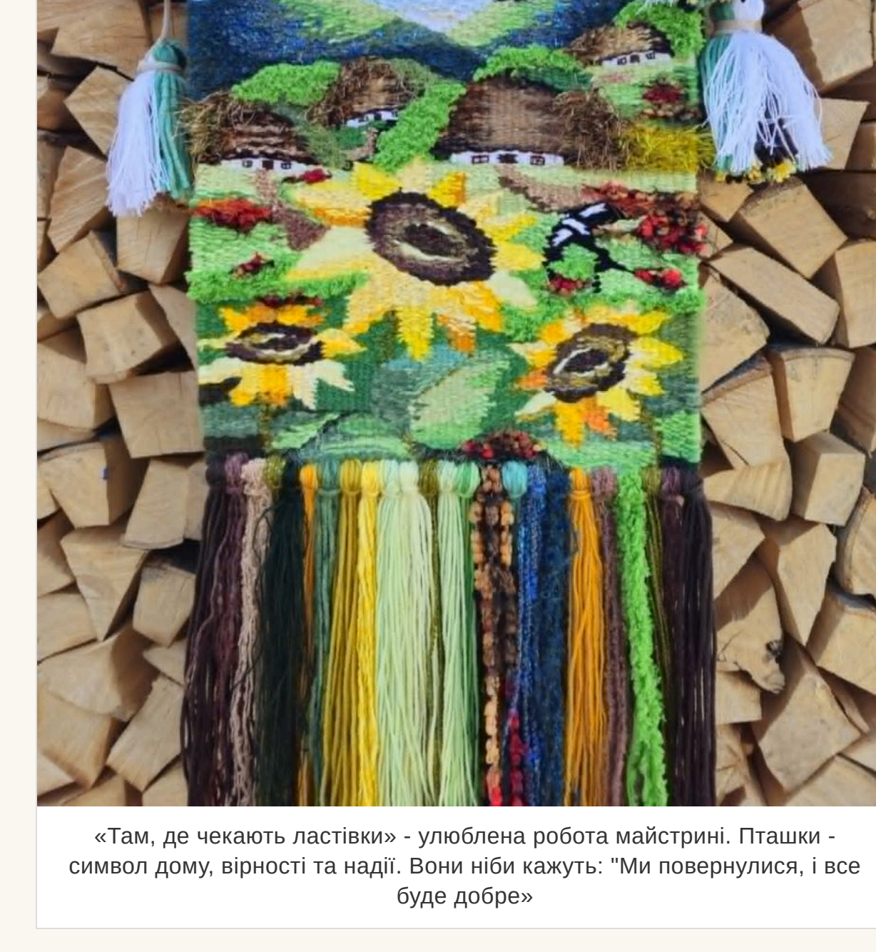
«Там, де чекають ластівки» - улюблена робота майстрині. Пташки - символ дому, вірності та надії. Вони ніби кажуть: «Ми повернулися, і все буде добре»

— «Там, де чекають ластівки». У соцімережах він став справжнім хітом переглядів, торкнувшись сердець більш ніж десятка тисяч людей. Можливо тому, що у кожного з нас є таке місце в пам'яті — воно пахне літом, чебрецем і теплим вітром, що спускається з гір.