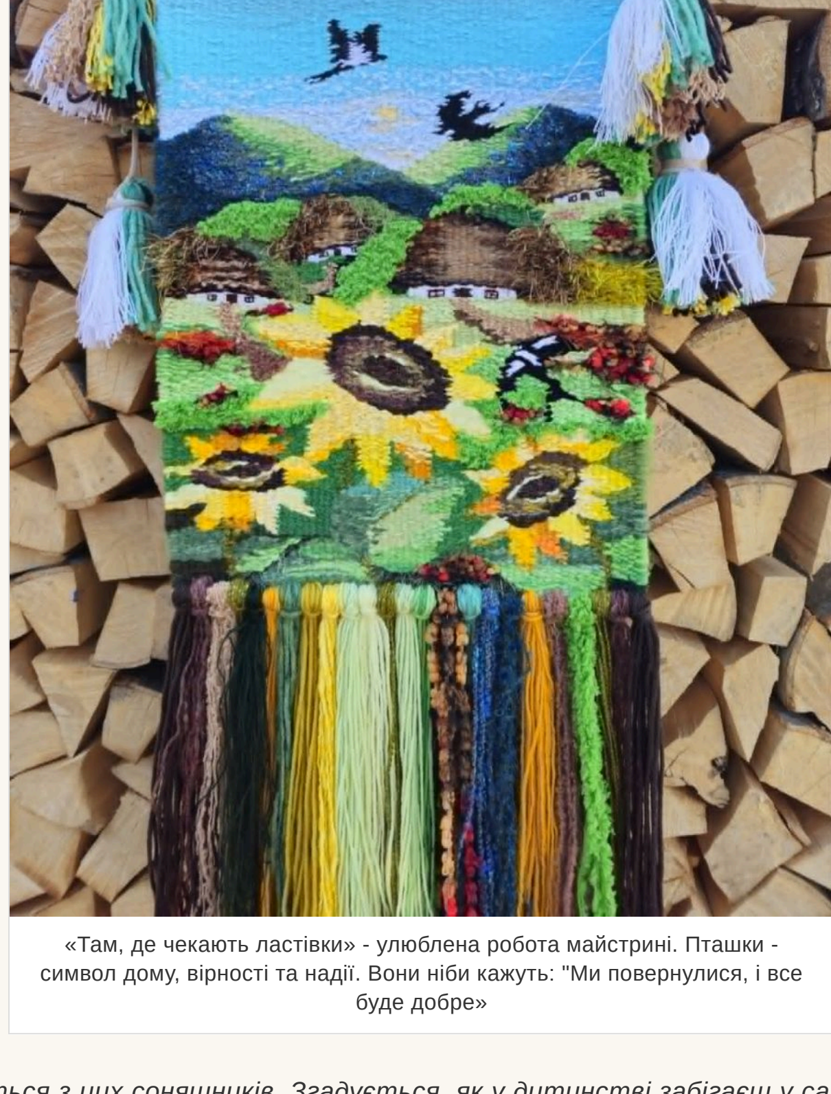
«Там, де чекають ластівки» - улюблена робота майстрині. Пташки - символ дому, вірності та надії. Вони ніби кажуть: "Ми повернулися, і все буде добре»

— «Там, де чекають ластівки». У соцмережах він став справжнім хітом переглядів, торкнувшись серцець більш ніж десятка тисяч людей! Можливо тому, що у кожного з нас є таке місце в пам'яті — воно пахне літом, чебрецем і теплим вітром, що спускається з гір.