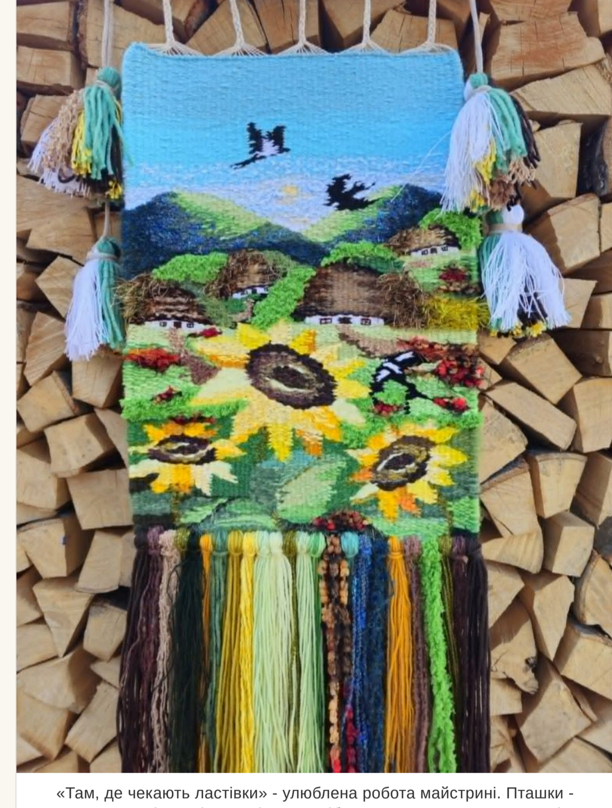
«Там, де чекають ластівки» - улюблена робота майстрині. Пташки - символ дому, вірності та надії. Вони ніби кажуть: "Ми повернулися, і все буде добре»

— «Там, де чекають ластівки». У соцмережах він став справжнім хітом переглядів, торкнувшись серцець більш ніж десятка тисяч людей. Можливо тому, що у кожного з нас є таке місце в пам'яті — воно пахне літом, чебрецем і теплим вітром, що спускається з гір.