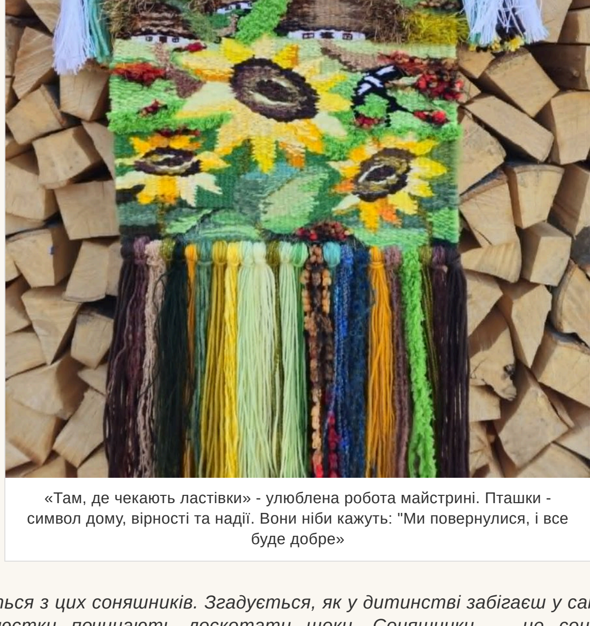
«Там, де чекають ластівки» - улюблена робота майстрині. Пташки - символ дому, вірності та надії. Вони ніби кажуть: "Ми повернулися, і все буде добре»

— «Там, де чекають ластівки». У соцімережах він став справжнім хітом переглядів, торкнувшись серцець більш ніж десятка тисяч людей. Можливо тому, що у кожного з нас є таке місце в пам'яті — воно пахне літом, чебрецем і теплим вітром, що спускається з гір.