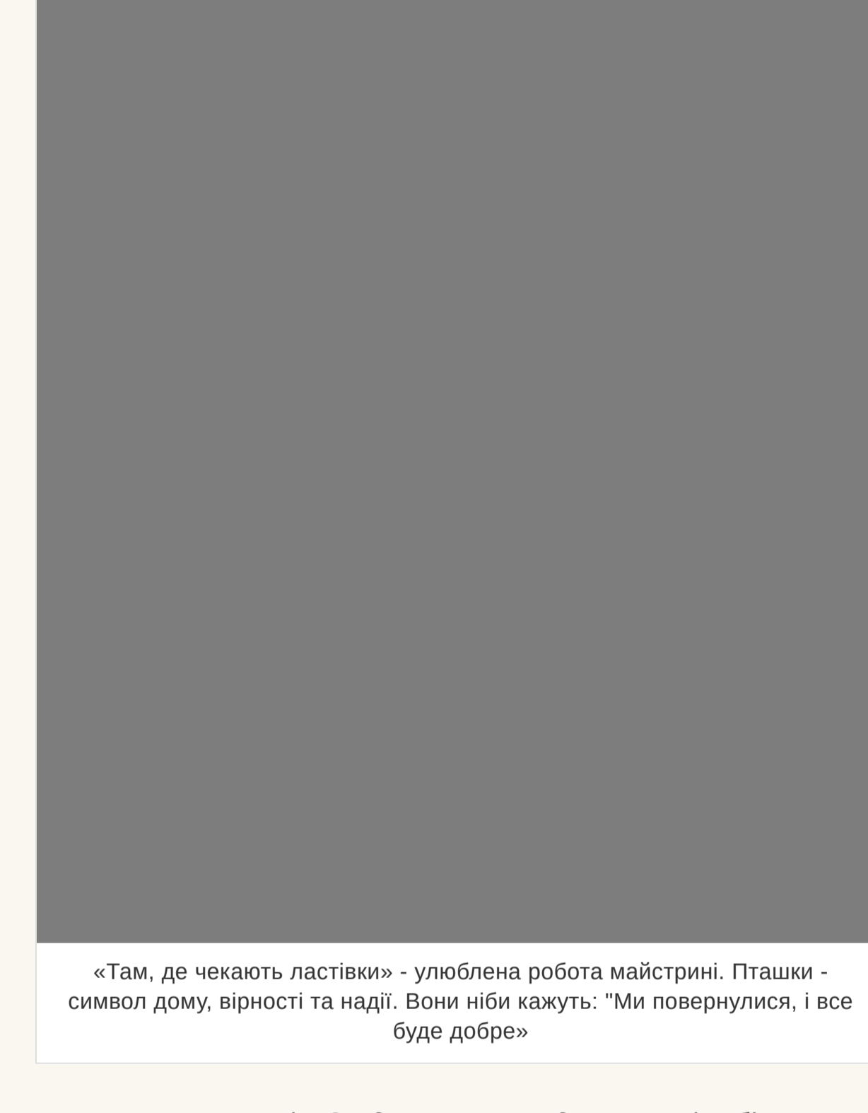
«Там, де чекають ластівки» - улюблена робота майстрині. Пташки - символ дому, вірності та надії. Вони ніби кажуть: "Ми повернулися, і все буде добре»

— «Там, де чекають ластівки». У соцмережах він став справжнім хітом переглядів, торкнувшись серцець більш ніж десятка тисяч людей. Можливо тому, що у кожного з нас є таке місце в пам'яті — воно пахне літом, чебрецем і теплим вітром, що спускається з гір.