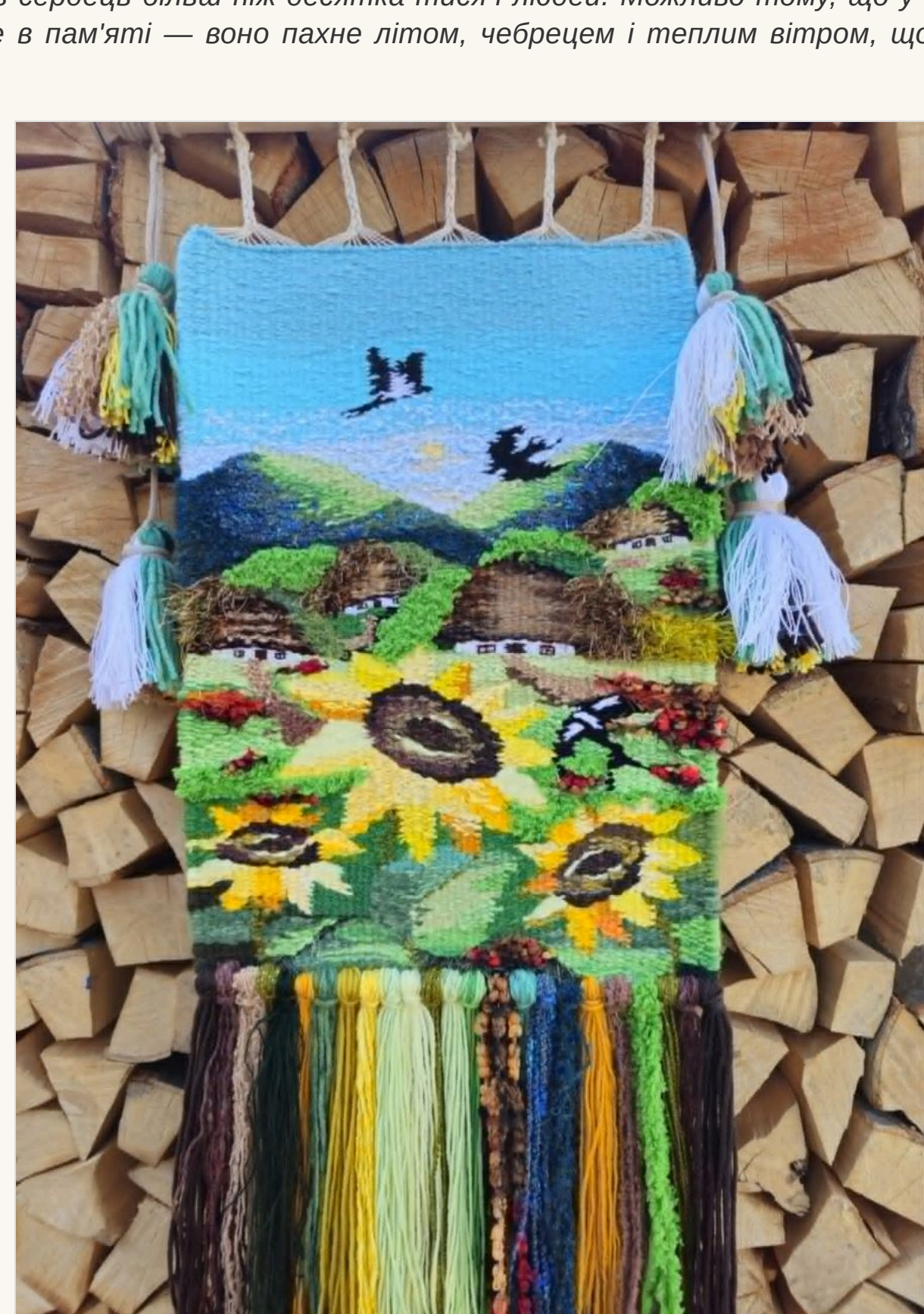
«Там, де чекають ластівки» - улюблена робота майстрині. Пташки - символ дому, вірності та надії. Вони ніби кажуть: "Ми повернулися, і все буде добре"

— «Там, де чекають ластівки». У соцмережах він став справжнім хітом переглядів, торкнувшись серцець більш ніж десятка тисяч людей. Можливо тому, що у кожного з нас є таке місце в пам'яті — воно пахне літом, чебрецем і теплим вітром, що спускається з гір.