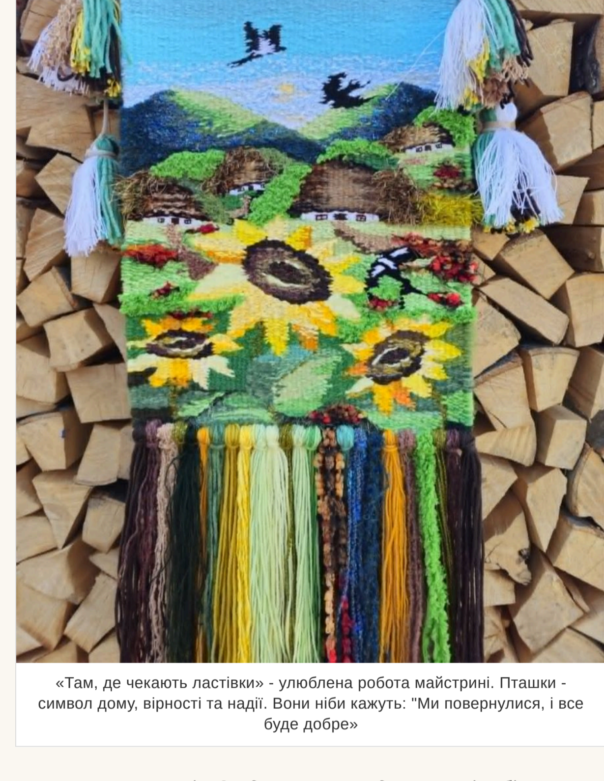
«Там, де чекають ластівки» - улюблена робота майстрині. Пташки - символ дому, вірності та надії. Вони ніби кажуть: "Ми повернулися, і все буде добре"

— «Там, де чекають ластівки». У соцмережах він став справжнім хітом переглядів, торкнувшись серцець більш ніж десятка тисяч людей. Можливо тому, що у кожного з нас є таке місце в пам'яті — воно пахне літом, чебрецем і теплим вітром, що спускається з гір.