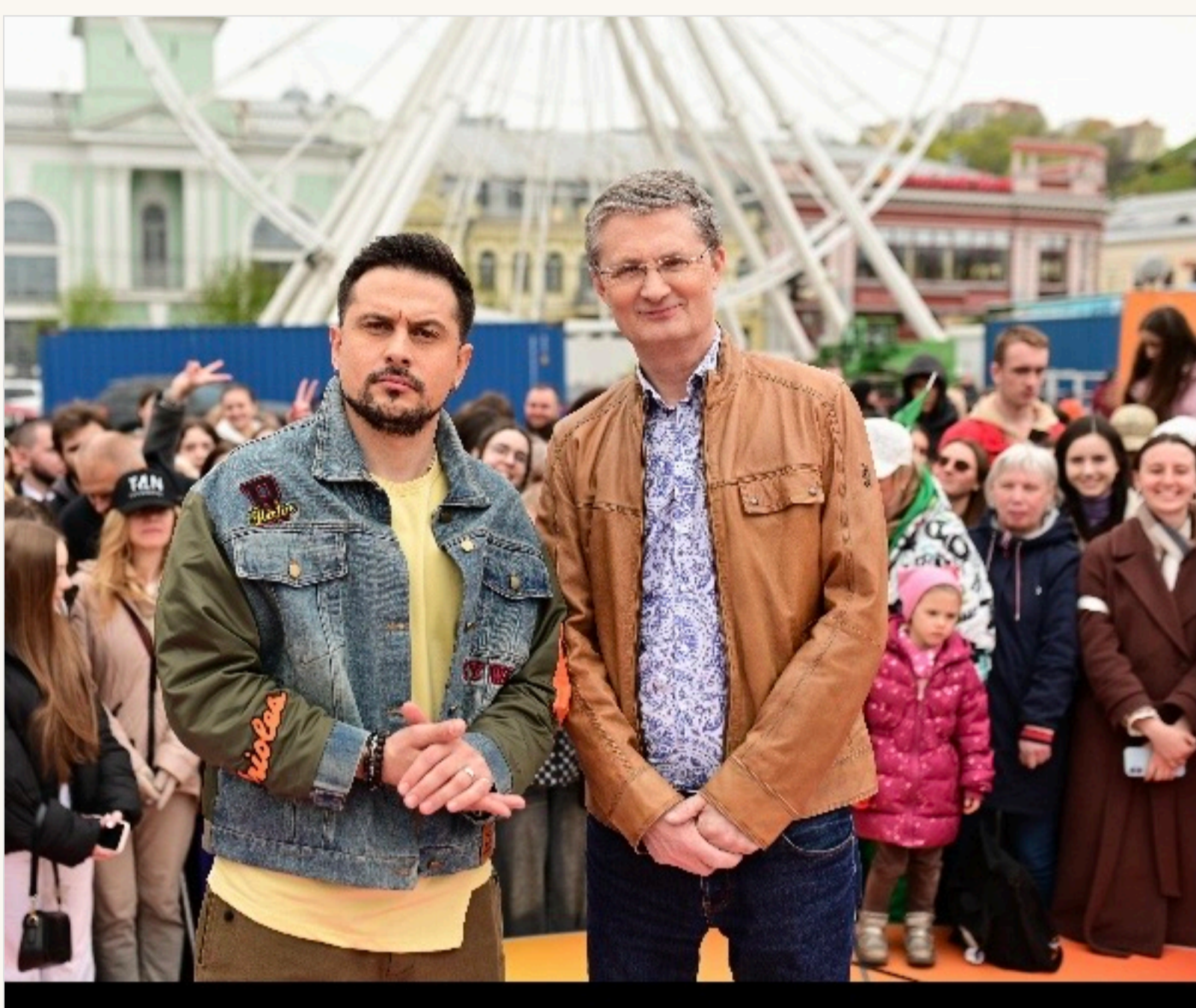
ХАС замінив Ігоря Кондратюка у легендарному шоу "Караоке на Майдані"

— Точно нам не було складно. Ми пройшли певну еволюцію відносин. Вперше ми познайомились з Ігорем Васильовичем на талант-шоу, коли мені було 19 років. Потім знову зустрілись, коли мені виповнився 21 рік. Це були «Україна має талант», «Х-фактор», я виступав як запрошений гість на «Караоке», потім читав новини в стилі реп на шоу «Кондратюк у понеділок». Кілька років ми не спілкувались і знову зустрілися на зйомках мого кліпу «До зими», в якому він зіграв самого себе. Тоді Ігор Васильович запитав, скільки мені років. Я сказав, що буде 35, і він зедава, що саме в ці роки розпочав «Караоке». На цьому все і завершилось, а пізніше він подзвонив і запропонував спробувати себе у ролі ведучого. Я взяв участь у кастингу і... пройшов.