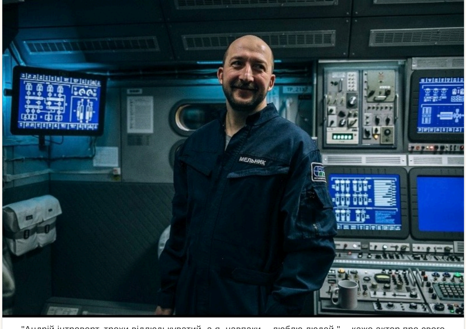
"Андрій інтроверт, трохи відлюдькуватий, а я, навпаки, - люблю людей.", - каже актор про свого героя

— В чомусь — так. Ми обидва любимо вінні і «вусатий фанк». В кадрі навіть є моя колекція вінилу. Бо коли я приїшов на знімальний майданчик, платівок було декілька, і я сказав, що принесу свої. В іншому ж — Андрій інтроверт, трохи відлюдькуватий, а я, навпаки, — люблю людей.