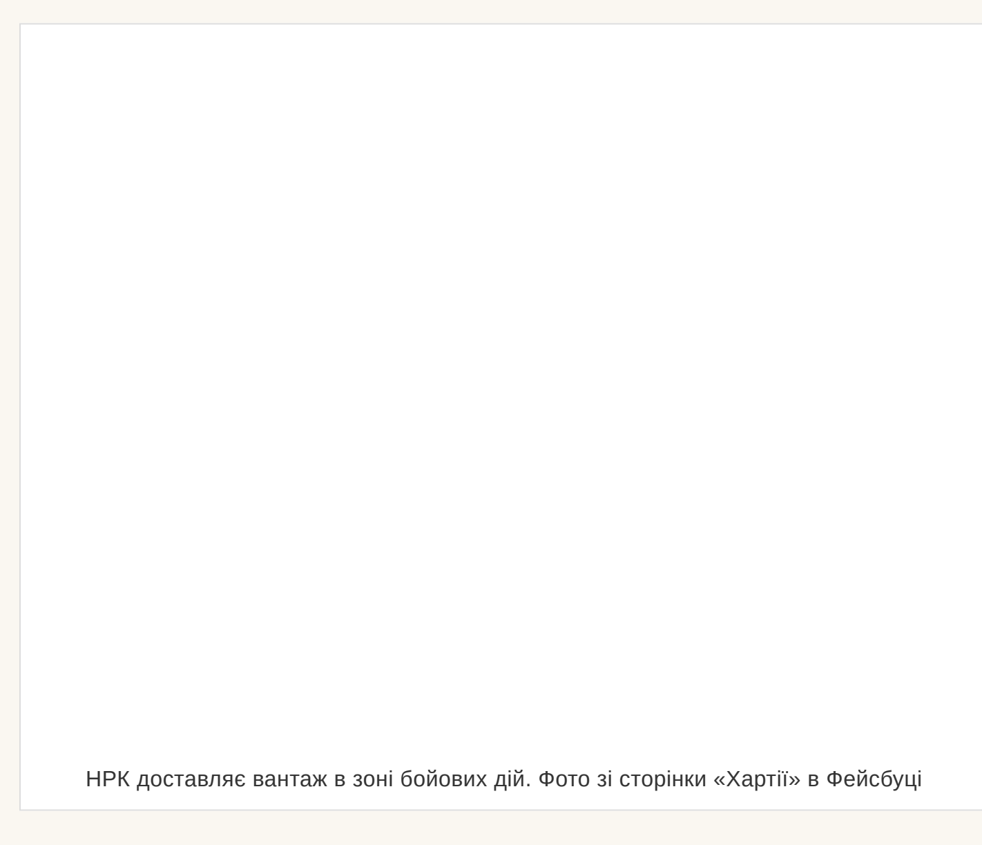
НРК доставляє вантаж в зоні бойових дій.

Щодо використання «Лавою» наземних дронів (НРК) то це вже стало стандартом. Лише в окремих випадках ми притамомо людей в безпосередній близькості до ліній розмежування.