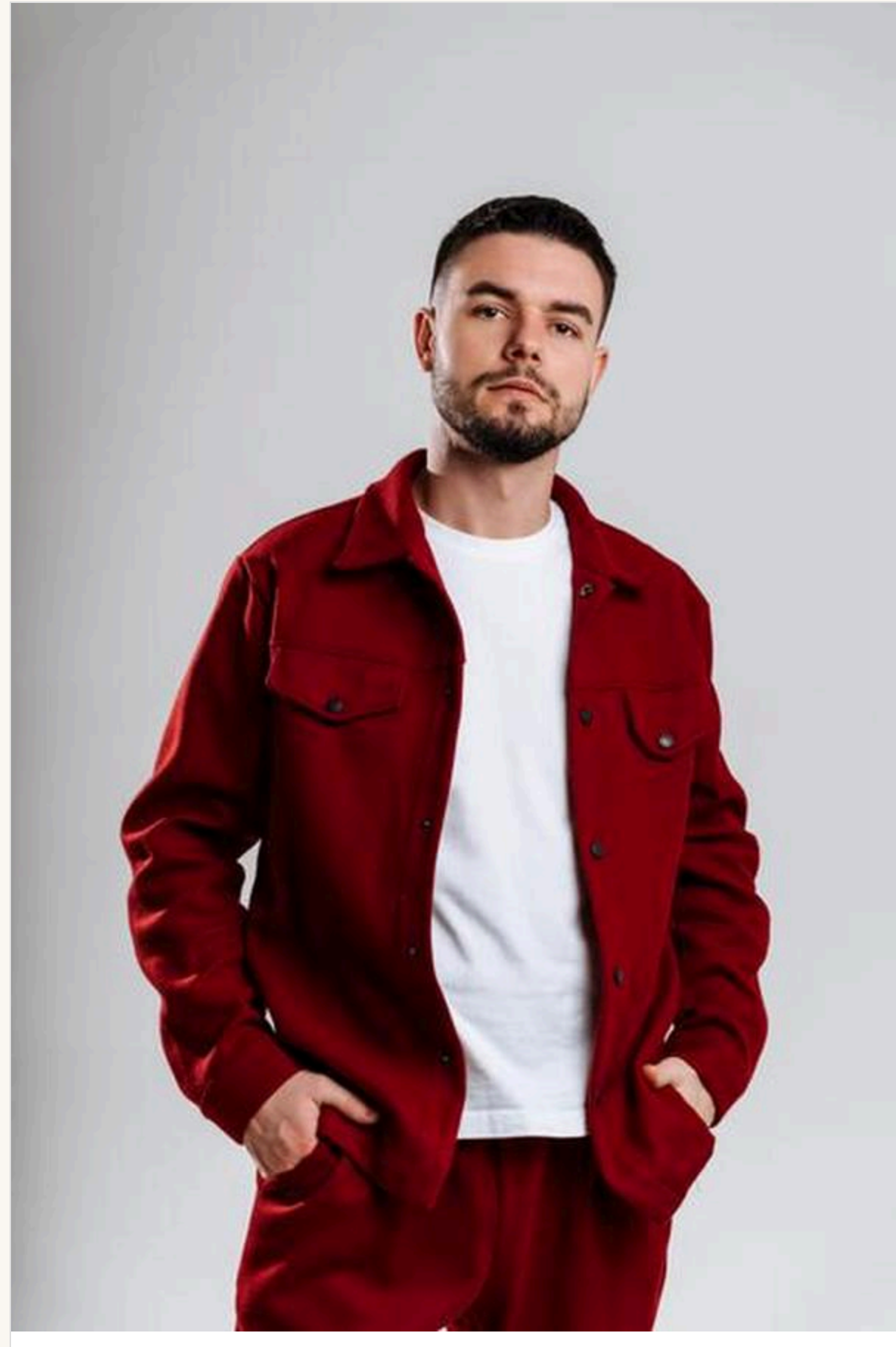
"З роками я навчився відділяти конструктивну критику від звичайного бажання когось образити.", - говорить співак

— Соцмережі дали людям голос. Це добре. Але разом із цим багато хто забув про відповідальність за свої слова. Дуже легко написати коментар під чужим відео, сидючи вдома на дивані. Складніше самому щось створити, вийти на сцену чи взяти відповідальність за власну справу.