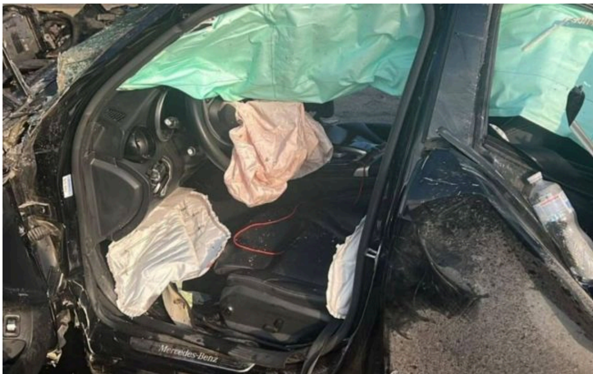
Фото: ДТП у Києві 5 червня (Офіс генпрокурора)