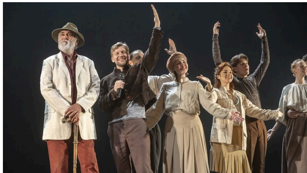
Допрем'єрний показ вистави "KING Лір! Версія". Національний академічний драматичний театр ім. Івана Франка, Київ, 04.06.2026