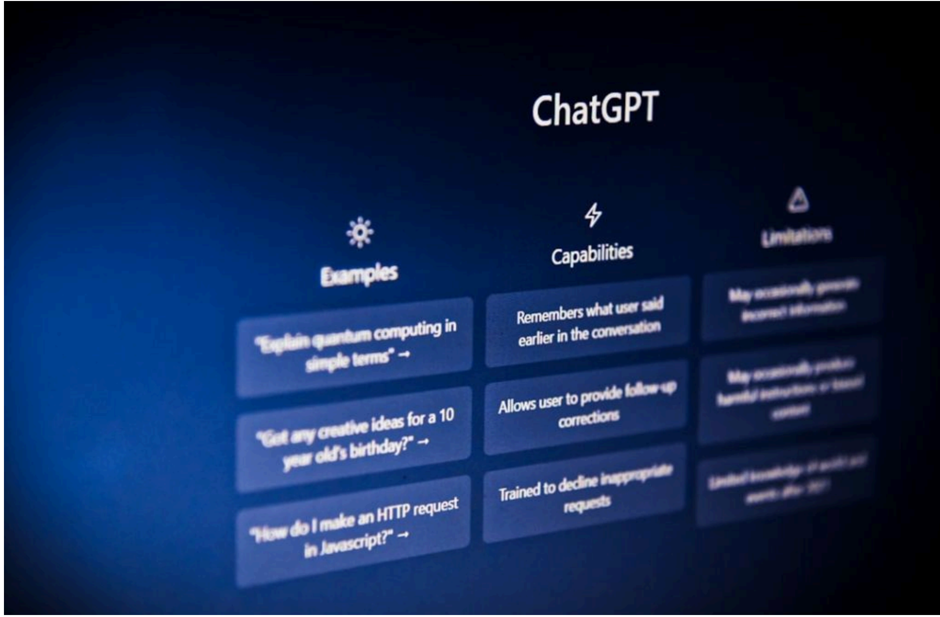
ChatGPT / © unsplash.com

ДМИТРУК АНДРІЙ — 05 Червня 2026, 18:30 2 Mins Read — ТЕХНОЛОГІЇ