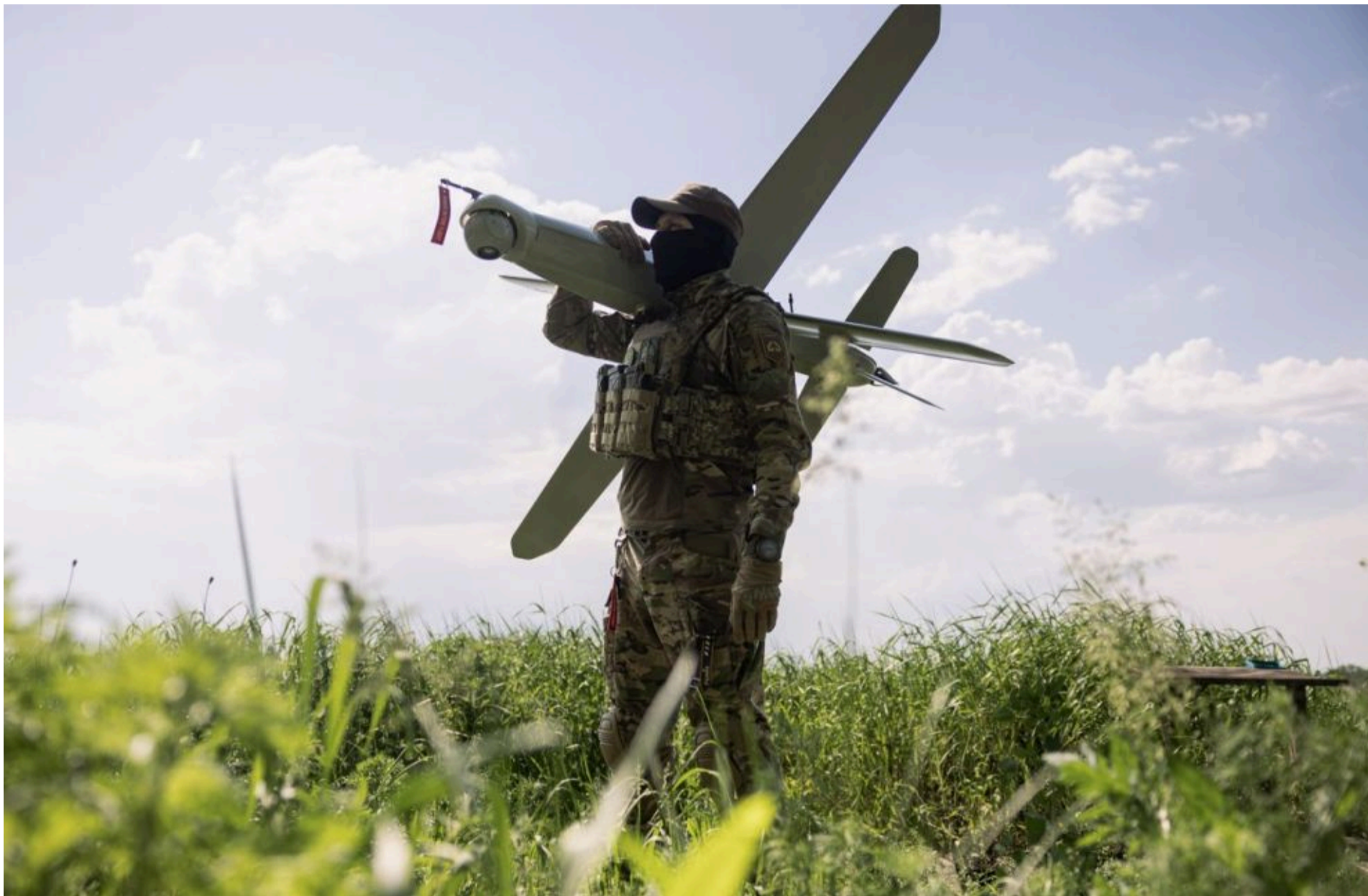
Сили безпілотних систем

КАРПЕЦЬ ОЛЕКСАНДР — 05 Червня 2026, 18:37 2 Mins Read — АРМІЯ І ЗБРОЯ