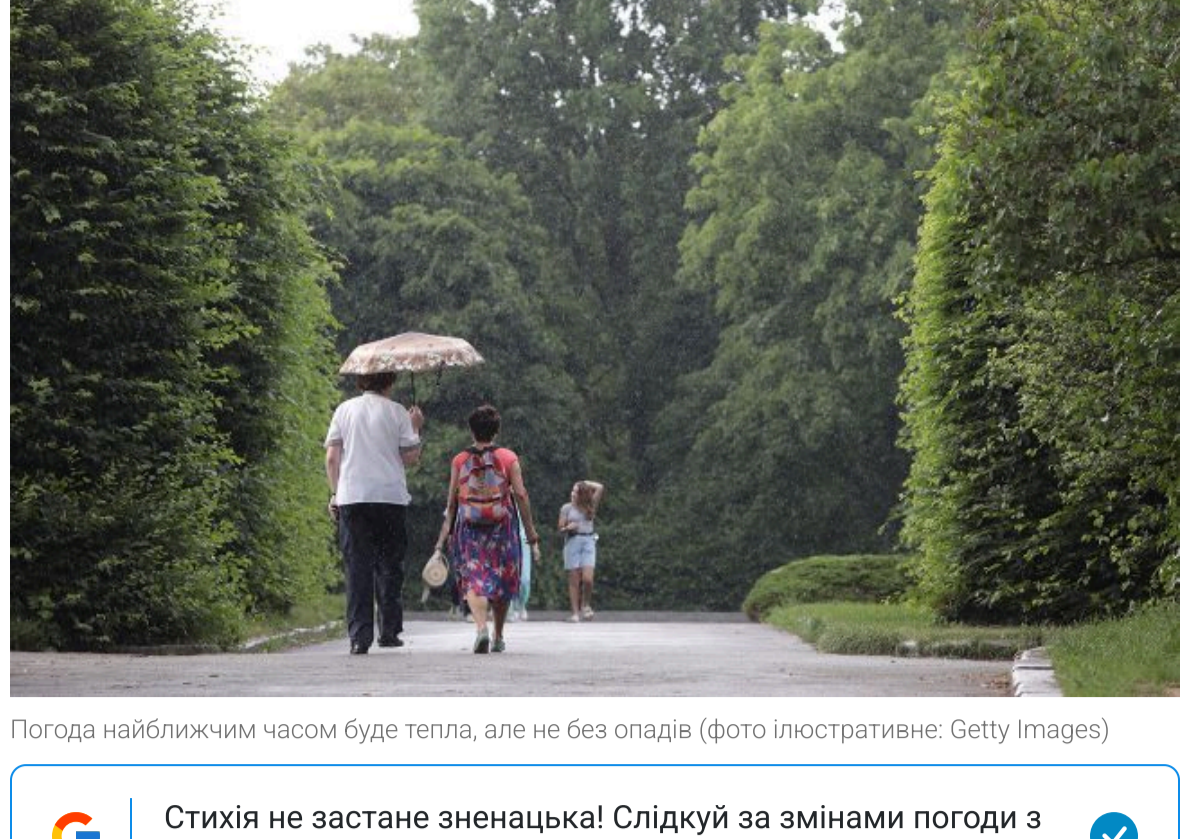
Погода найближчим часом буде теплою, але не без опадів

🔍 Стихія не застане зненацька! Слідкуй за змінами погоди з РБК-Україна у Google