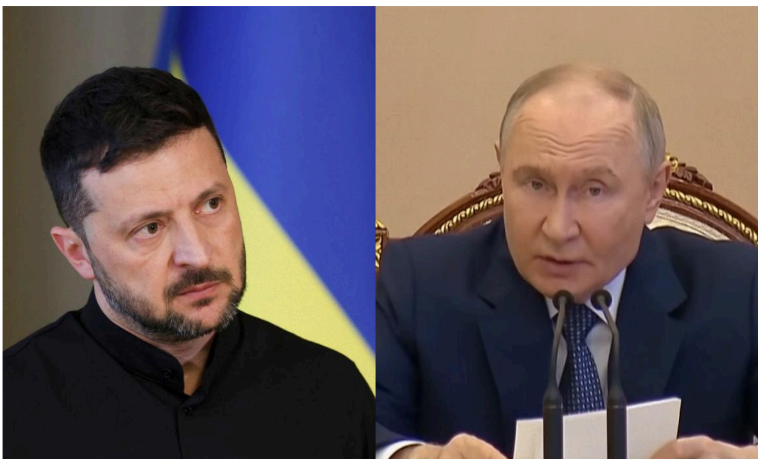
Нардеп прокоментував лист Зеленського до Путіна / колаж УНІАН, фото УНІАН, скріншот

Цей лист перекидає м'яч на сторону Путіна, і якщо він не погоджується на зустріч, то це робить очевидною його незацікавленість у мирі та перемовинах.