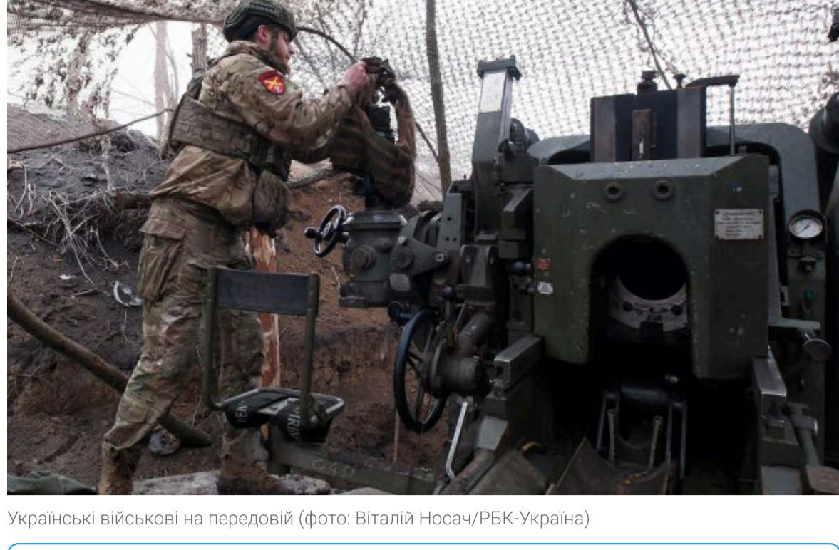
Українські військові на передовій

Не витрачай час на шум! Читай тільки суть з РБК-Україна у Google