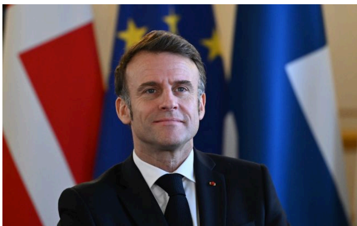
Фото: президент Франції Емманюель Макрон

Не витрачай час на шум! Читай тільки суть з РБК-Україна у Google