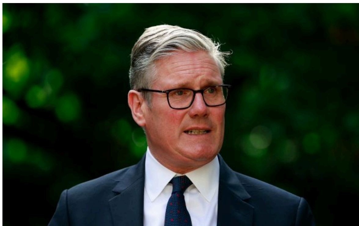
Фото: Кір Стармер (Getty Images)