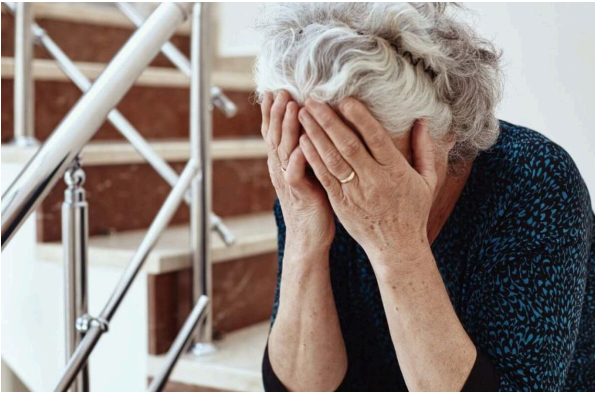
Борги / Фото з відкритих джерел

ЛИСЕНКО КАТЕРИНА — 05 Червня 2026, 16:49 2 Mins Read — СУСПІЛЬСТВО