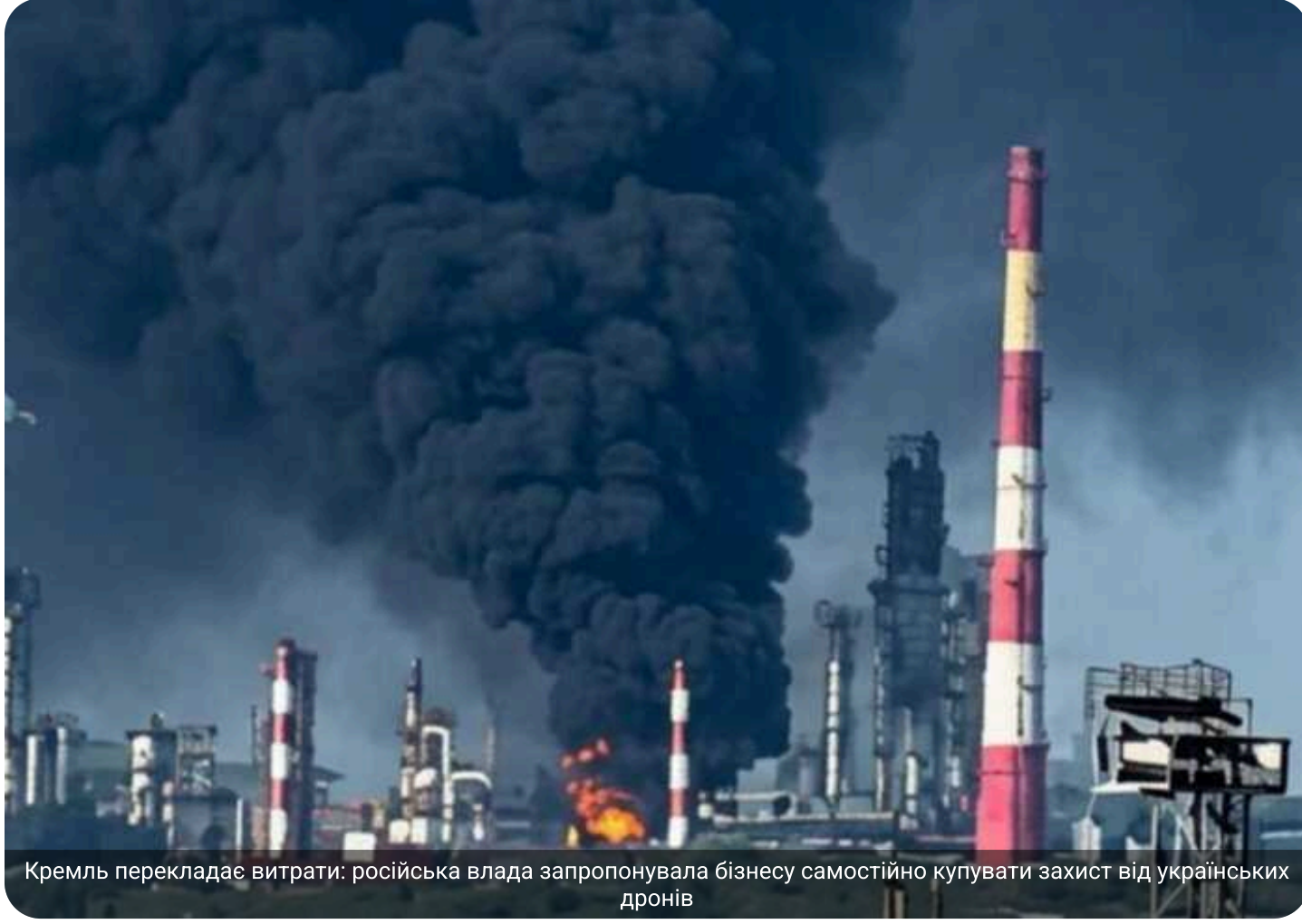
Кремль перекладає витрати: російська влада запропонувала бізнесу самостійно купувати захист від українських дронів

Російська влада не збирається створювати окремі фонди для захисту підприємств паливно-енергетичного комплексу від атак безпілотників – закупівлю необхідного обладнання компанії мають забезпечити власним коштом.