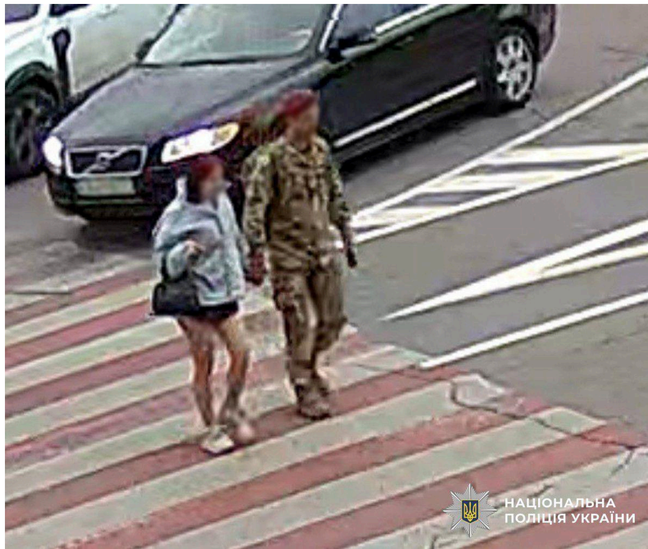
НАЦІОНАЛЬНА ПОЛІЦІЯ УКРАЇНИ