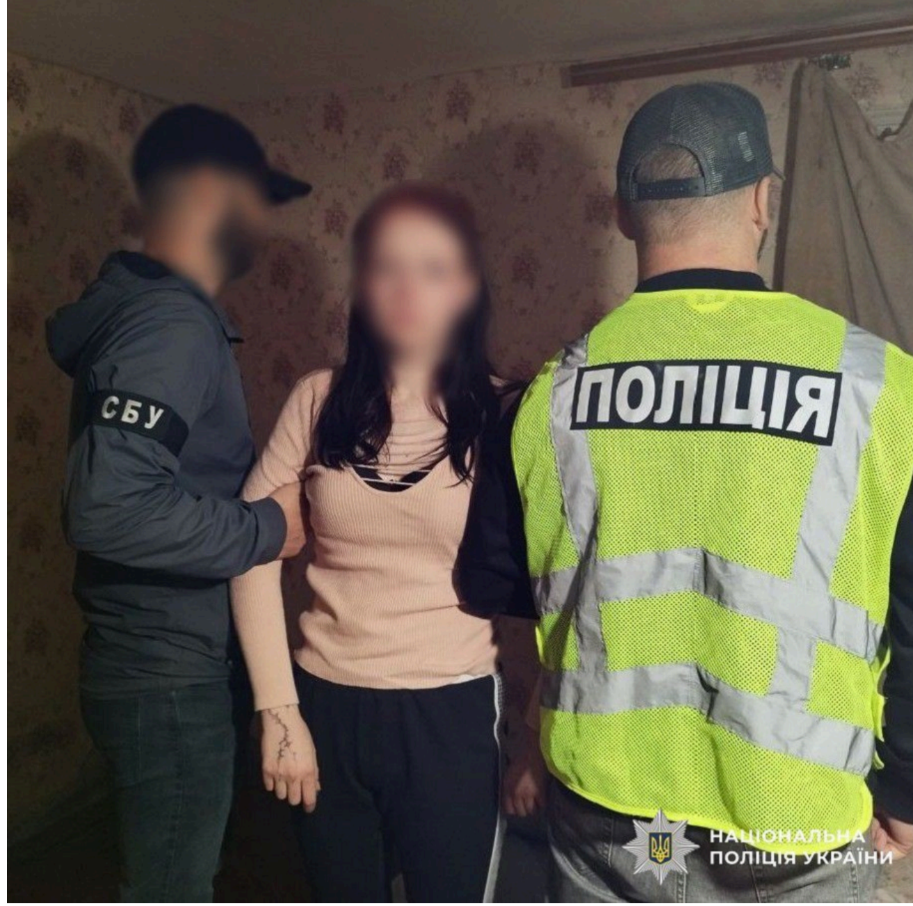
НАЦІОНАЛЬНА ПОЛІЦІЯ УКРАЇНИ

Наразі вирішується питання про повідомлення затриманій про підозру вчиненні тяжкого злочину та обрання їй запобіжного заходу. Встановлено, що вона раніше вже притягувалася до кримінальної відповідальності за наркозлочини та злочини проти громадської безпеки.