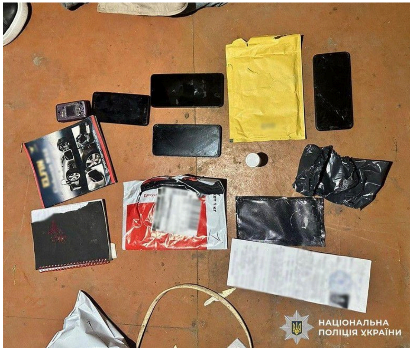
НАЦІОНАЛЬНА ПОЛІЦІЯ УКРАЇНИ

Попередньо встановлено, що вона спілкувалася в телеграм-каналі з чоловіком, який імовірно є представником спецслужб РФ. За його вказівкою наприкінці травня дівчина отримала через поштомат посилку, в якій знаходилась кристалічна речовина, попередньо – метадон. Куратор дав їй завдання зустрітись з військовослужбовцем, вказавши час і місце зустрічі. Фігурантка погодилася та пішла з новим знайомим до орендованого ним помешкання. Там вона підсипала до алкоголю заздалегідь підготовлений наркотик, а коли чоловік втратив свідомість – пішла геть, – розповіли у поліції.