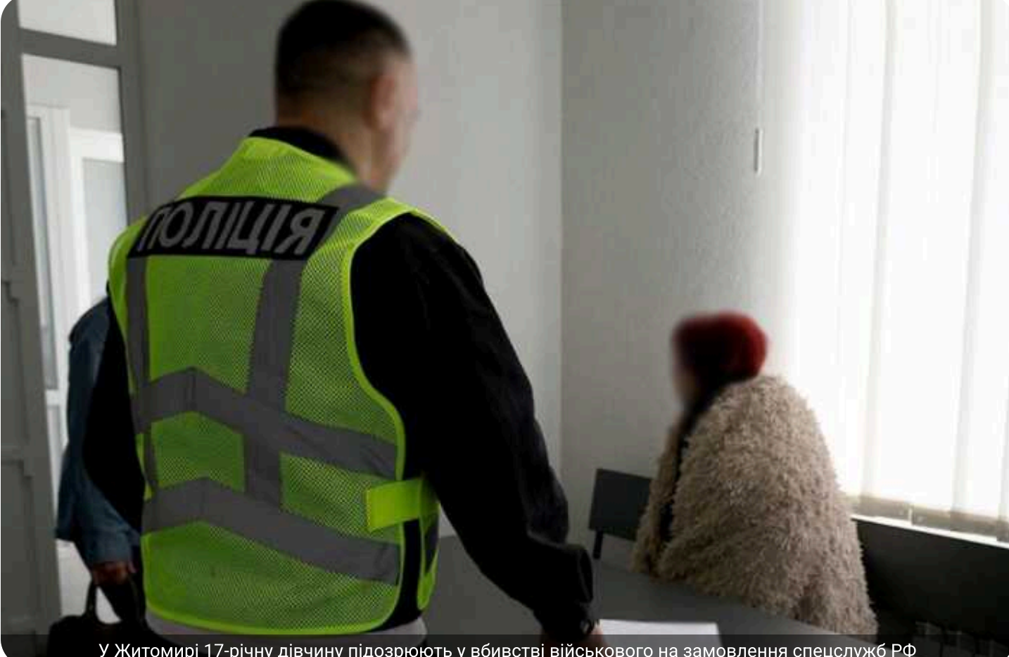
У Житомирі 17-річну дівчину підозрюють у вбивстві військового на замовлення спецслужб РФ

На Житомирщині правоохоронці затримали 17-річну дівчину за підозрою у вбивстві військового, яке, за даними слідства, було скоєне на замовлення російської сторони.