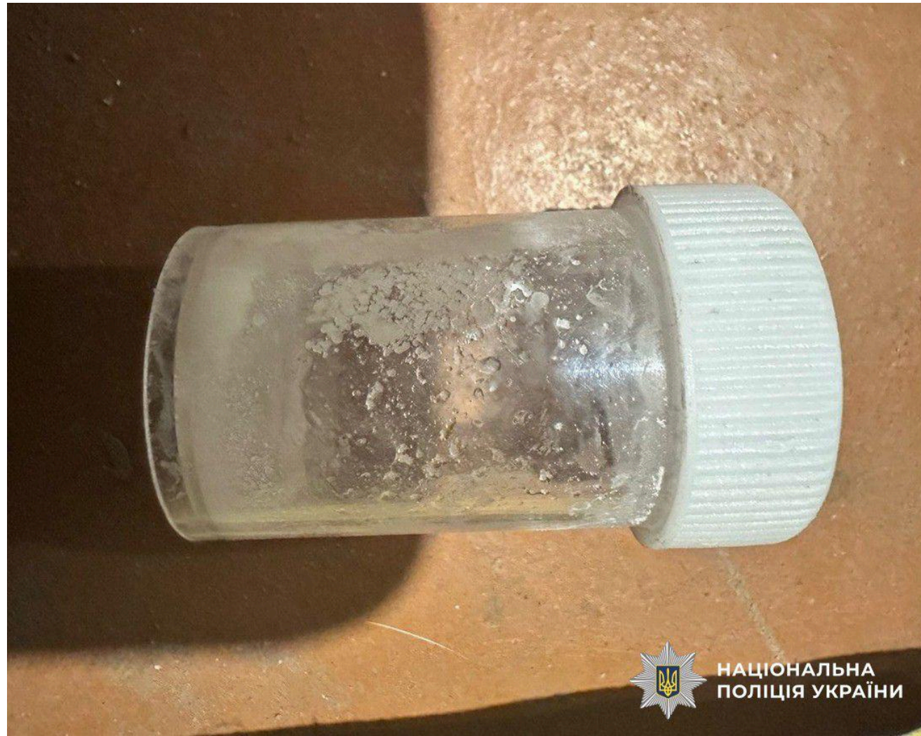
НАЦІОНАЛЬНА ПОЛІЦІЯ УКРАЇНИ