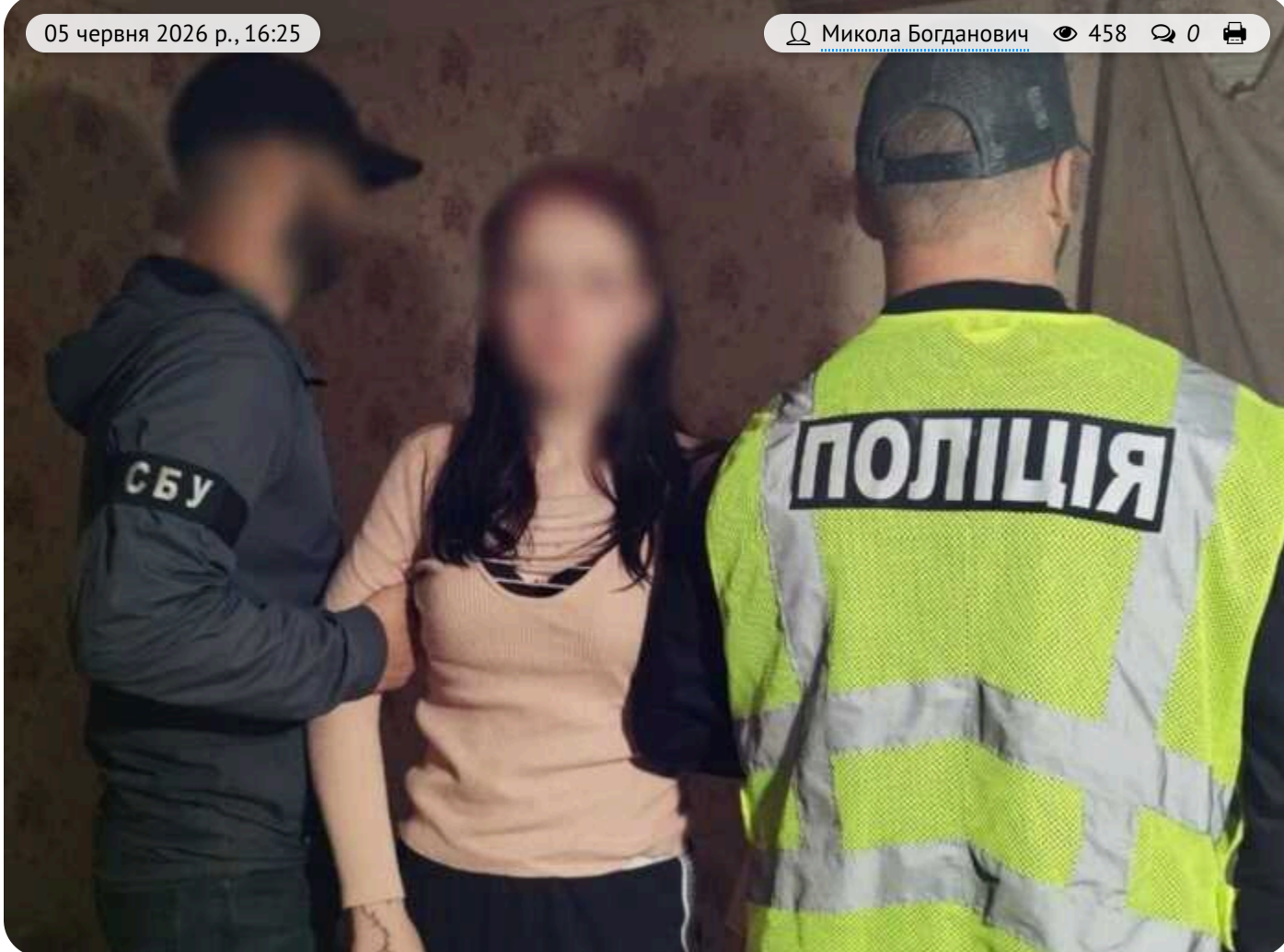
На Житомирщині затримали 17-річну дівчину за підозрою у вбивстві військового на замовлення РФ

На Житомирщині затримано 17-річну дівчину за підозрою у вбивстві 27-річного військового на замовлення РФ.