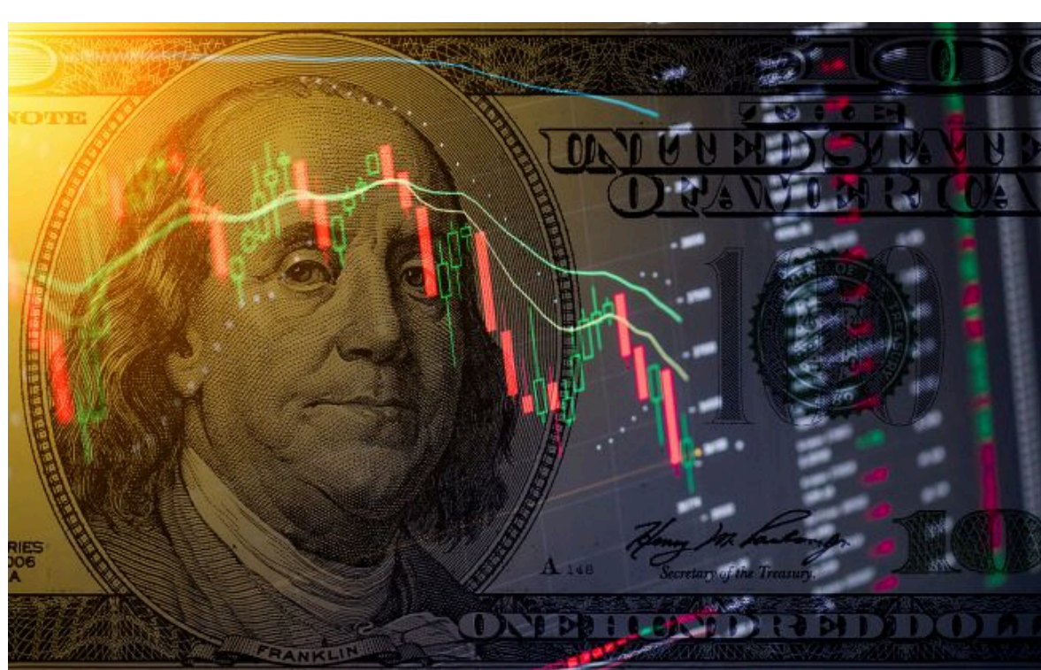
Фото: НБУ незначно знизив офіційний курс долара та євро на початок нового тижня (Getty Images)

Не чекай змін - готуйся до них! Фільтруй валютні коливання з РБК-Україна у Google