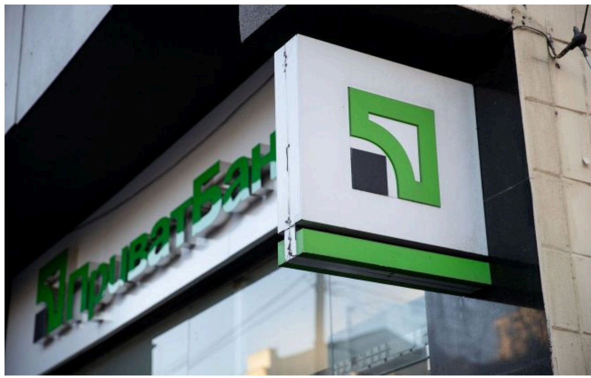
Фото: масштабний збій у роботі Приват24

Не витрачай час на шум! Читай тільки суть з РБК-Україна у Google