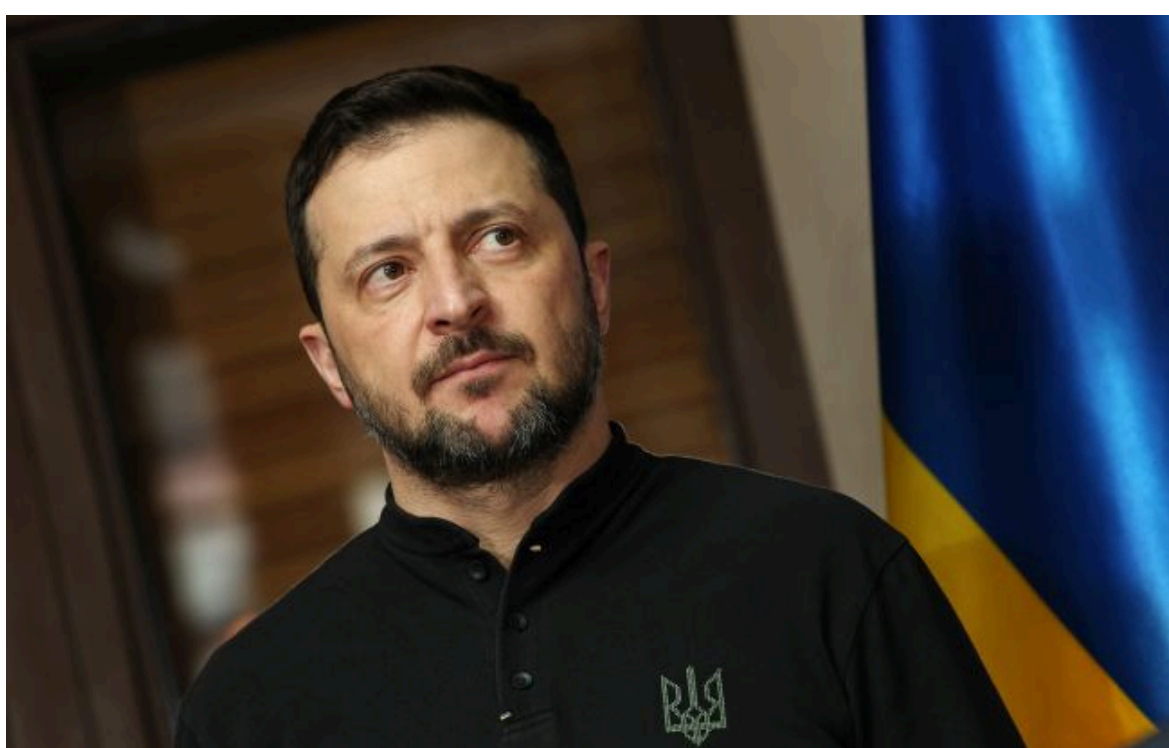
Фото: Володимир Зеленський (Gettyimages)