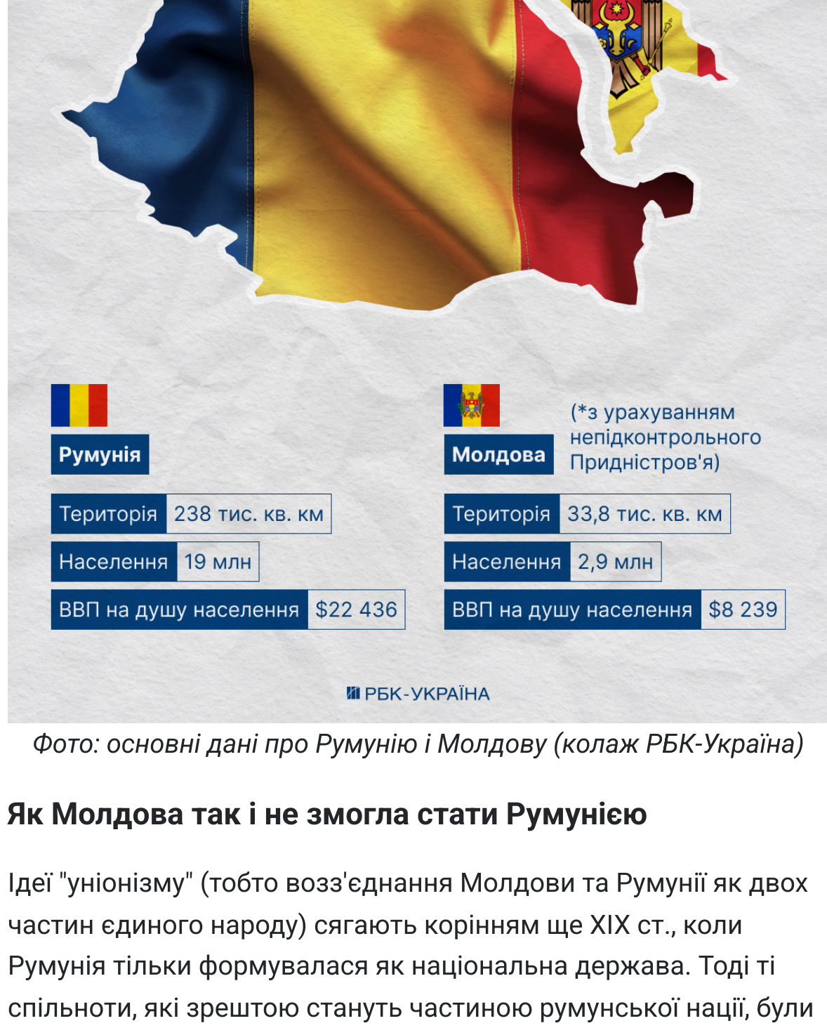
Фото: основні дані про Румунію і Молдову (колаж РЕК-Україна)

І вже давно нікого не дивує, що молдовське керівництво має румунські паспорти та відкрито голосує на виборах у сусідній державі.