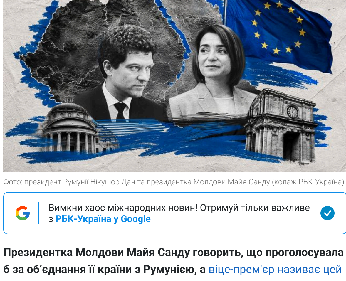
Фото: президент Румунії Нікушо Дан та президентка Молдови Майя Санду

Вимки хаос міжнародних новин! Стримуй тільки важливе з РЕК-Україна у Google