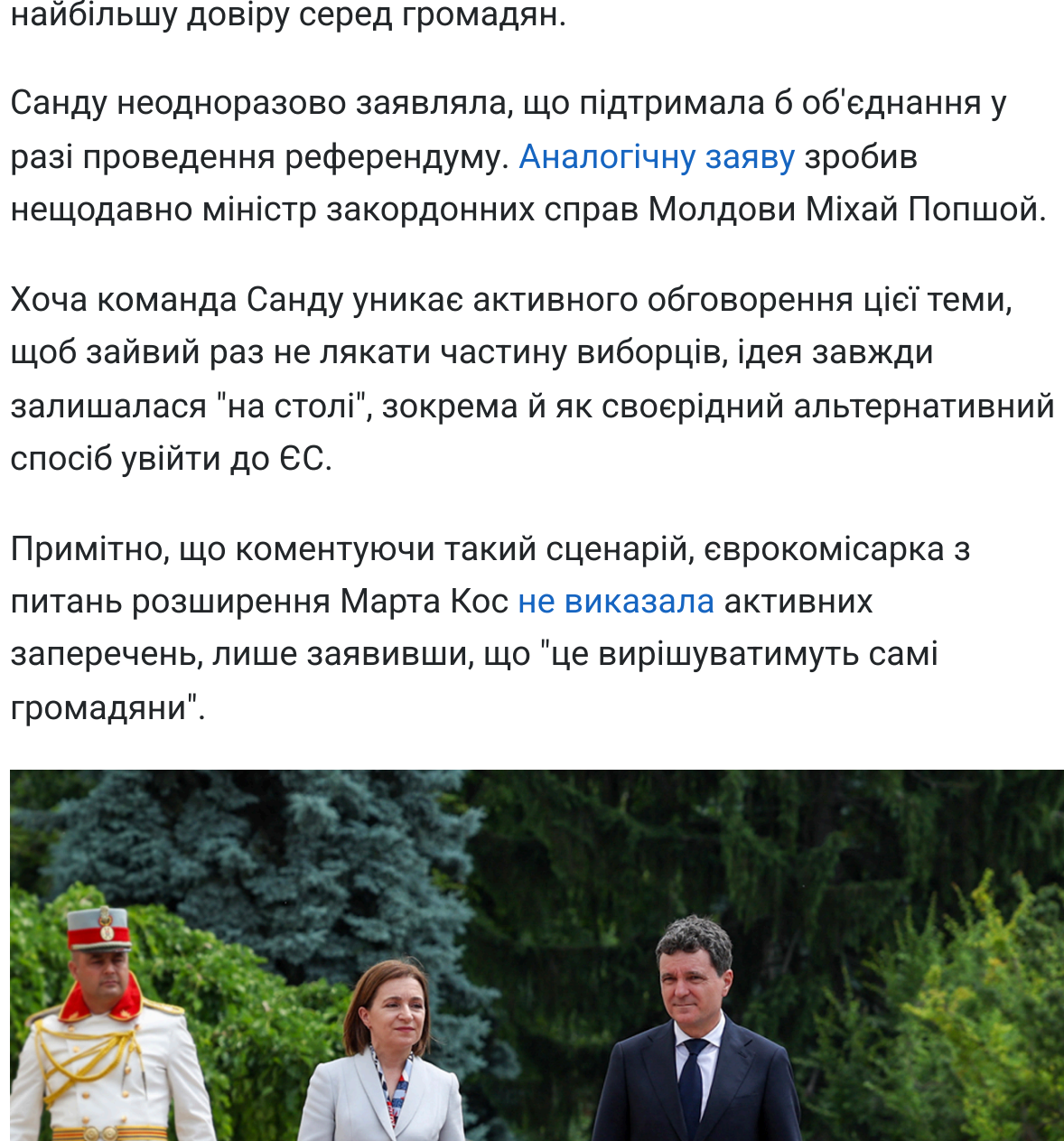
Фото: президентка Молдови Майя Санду та президент Румунії Нікушо Дан (Getty Images)

Примітно, що коментуючи такий сценарій, єврокомісарка з питань розширення Марта Кос не виказала активних заперечень, лише заявивши, що "це вирішуватимуть самі громадяни".