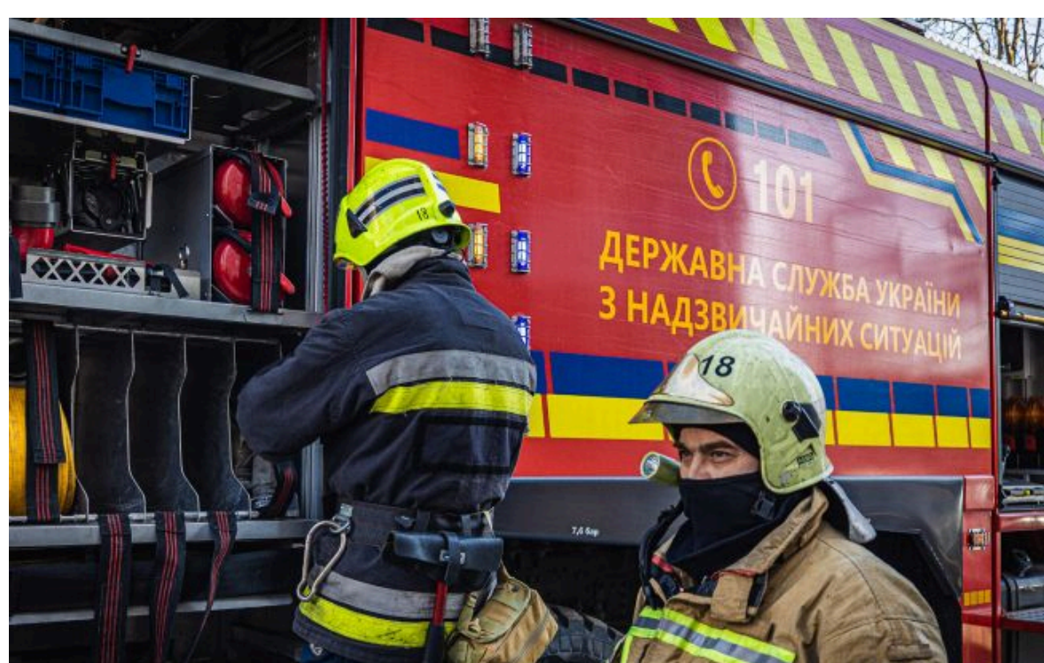
Фото: РФ ударила балістикою по Одещині