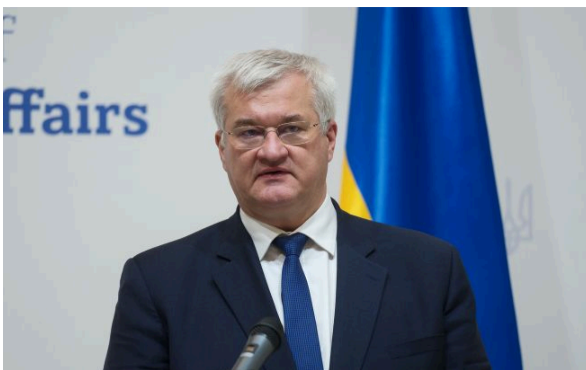
Фото: Андрій Сибіга, міністр закордонних справ України (Віталій Носач, РБК-Україна)