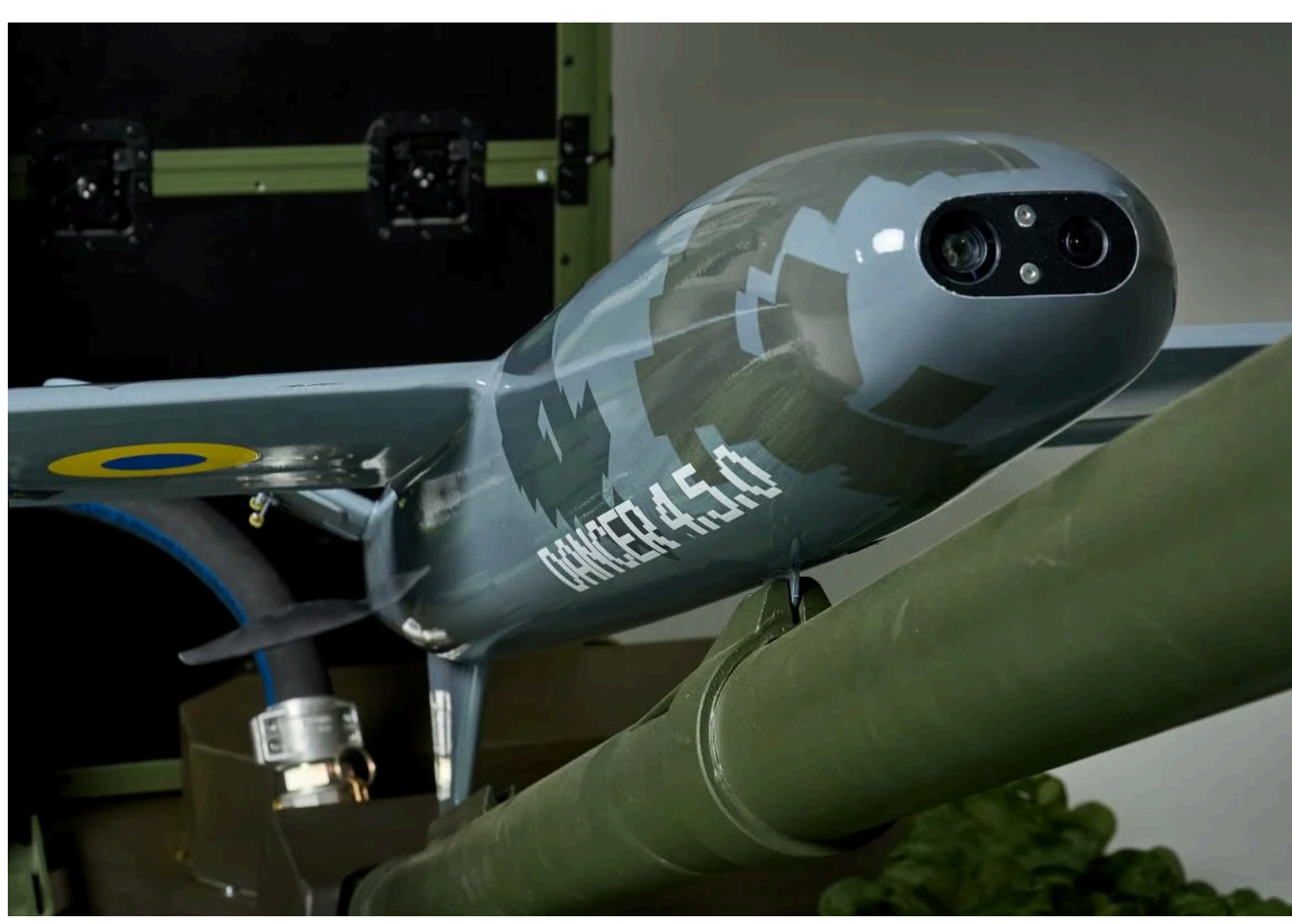
Блак "DANCER 4.5.0". Фото YARTURA

DANCER 4.5.0 – один із перших українських defence-tech продуктів із власною креативною концепцією. За створенням бойового дрона стоїть R&D-команда YARTURA, а його візуальну мову розробила Vandog Agency. З нагоди виходу продукту на ринок компанії оголосили про початок співпраці. Розповімо, як народився цей проєкт і що стоїть за новим партнерством.