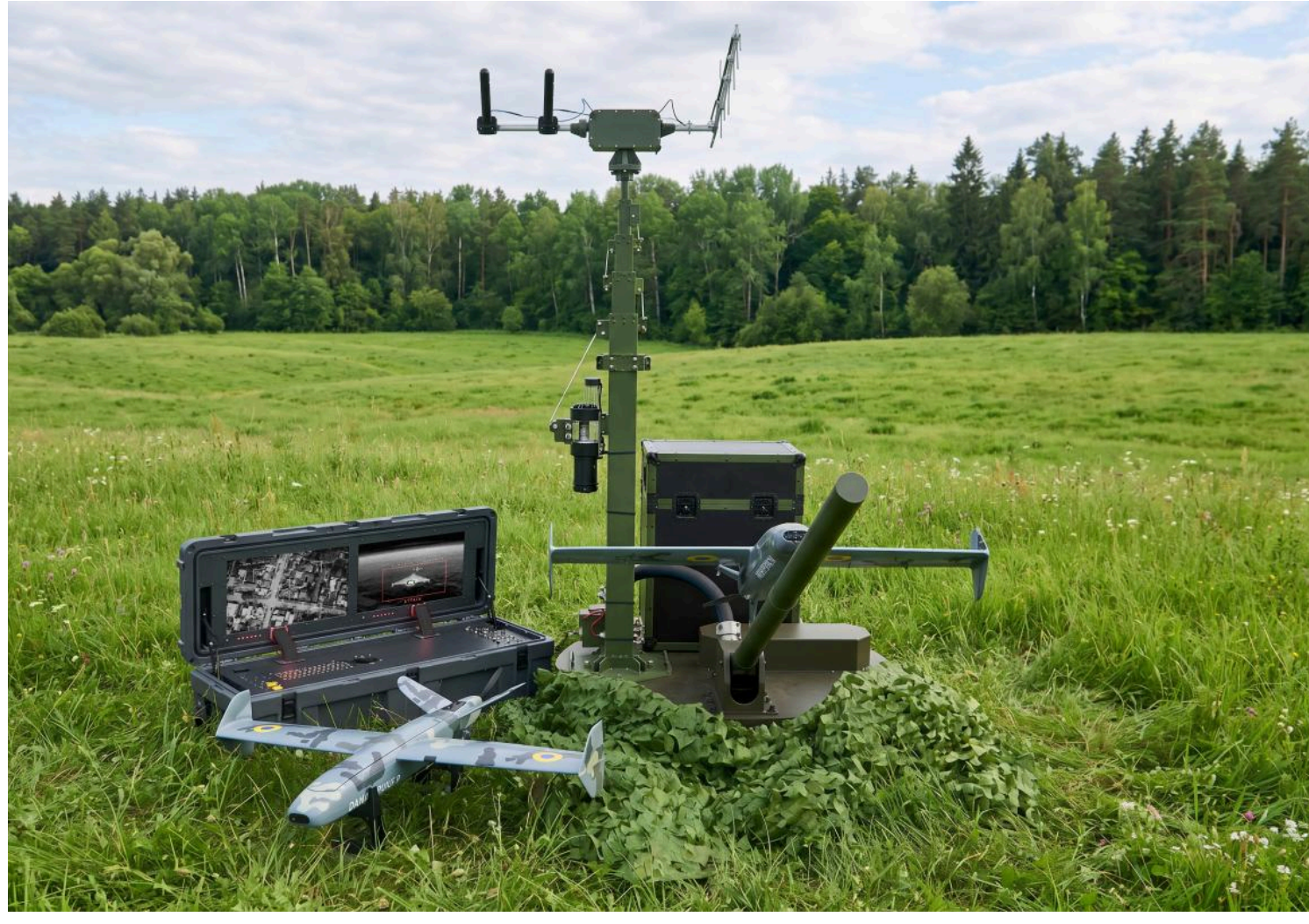
Дрон-перехоплювач призначений для полювання на ворожі БПЛА із швидкістю польоту 450 км/год.