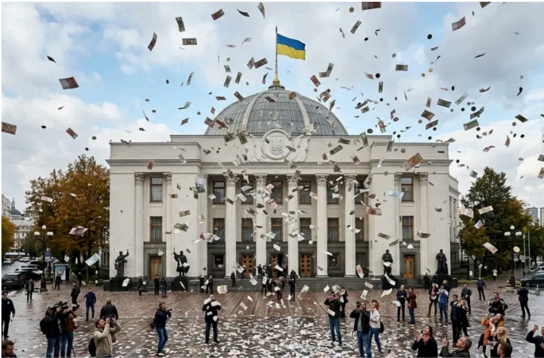
Верховна Рада

КАРПЕЦЬ ОЛЕКСАНДР — 05 Червня 2026, 15:29 2 Mins Read — ПОЛІТИКА