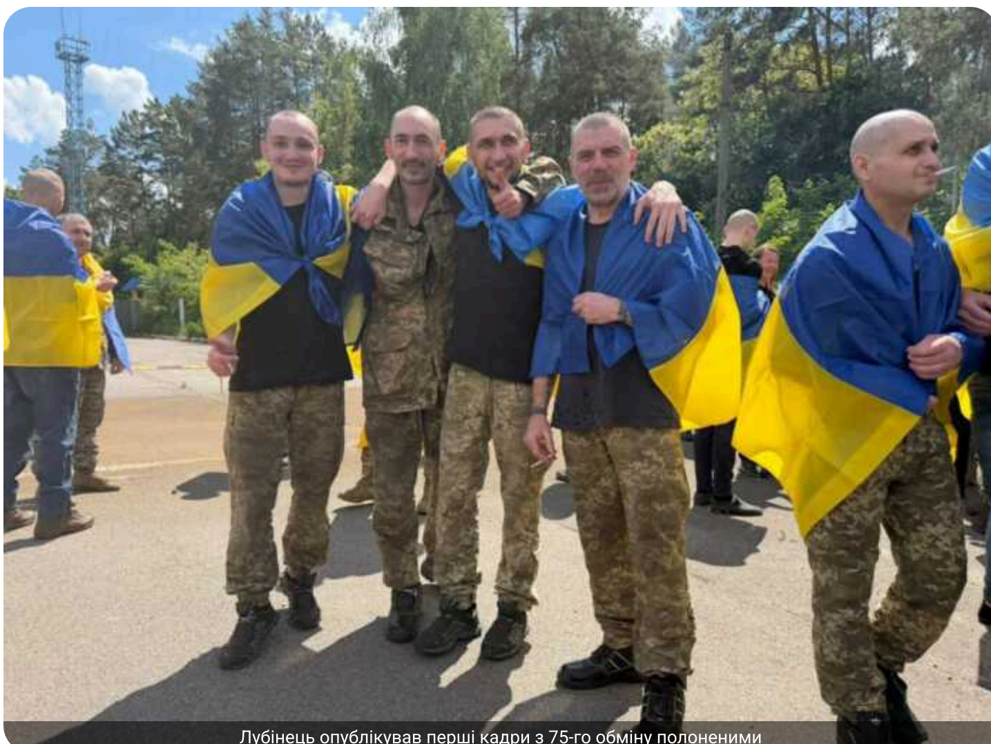
Лубінець опублікував перші кадри з 75-го обміну полоненими

Омбудсмен Дмитро Лубінець показав перше відео з 75-го обміну полоненими.