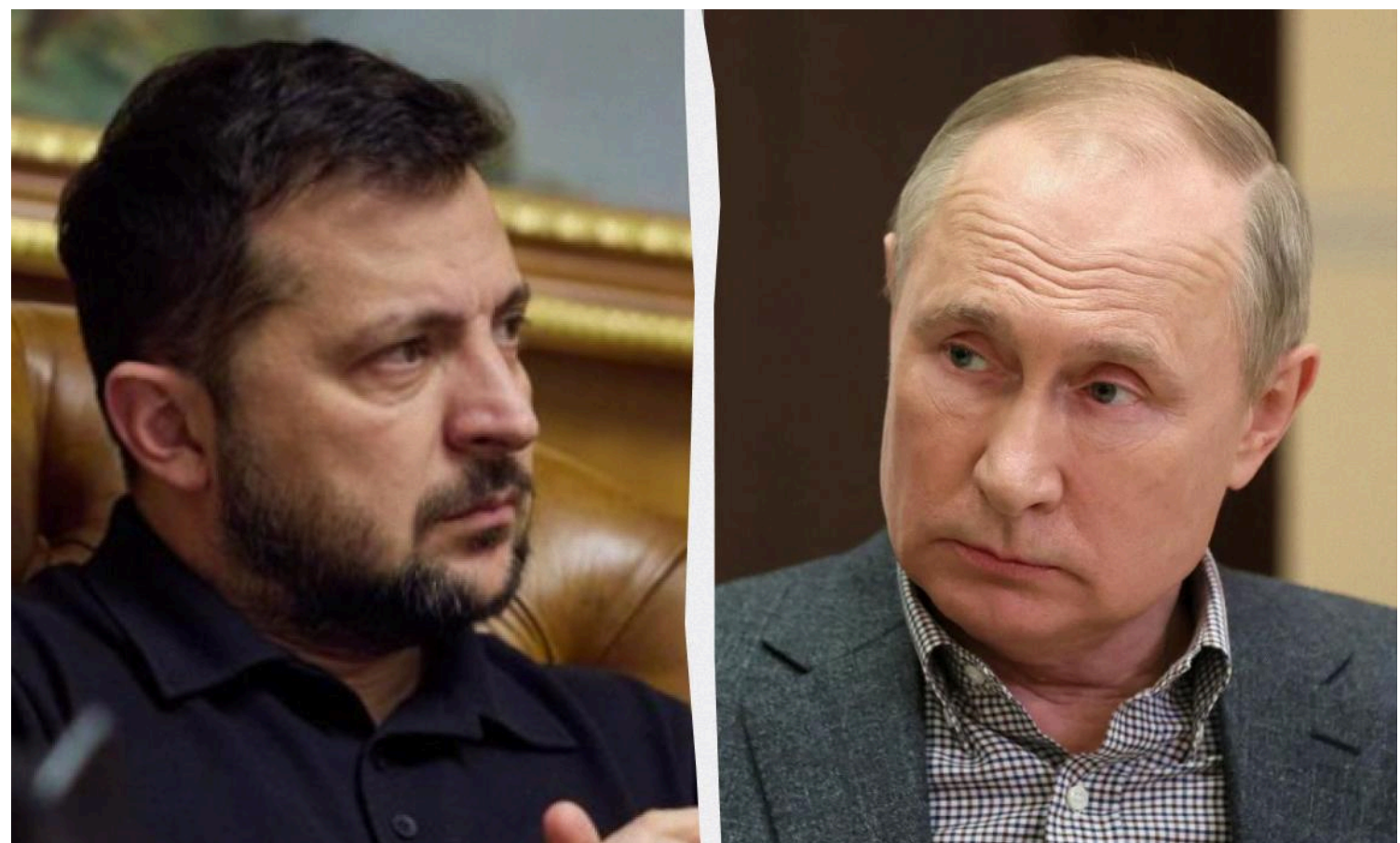
Зеленський зробив маленьку сенсацію своїм зверненням до Путіна

Дипломатичний жест українського президента не залишився непоміченим у світовому медіапросторі.