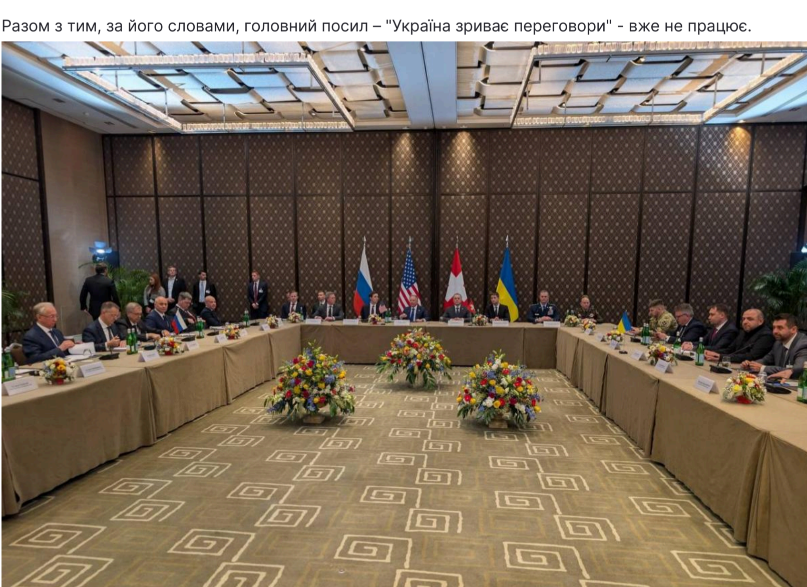
Посил Путіна про те, що Україна нібито зриває переговори - не працює

Разом з тим, за його словами, головний посыл – "Україна зриває переговори" – вже не працює.