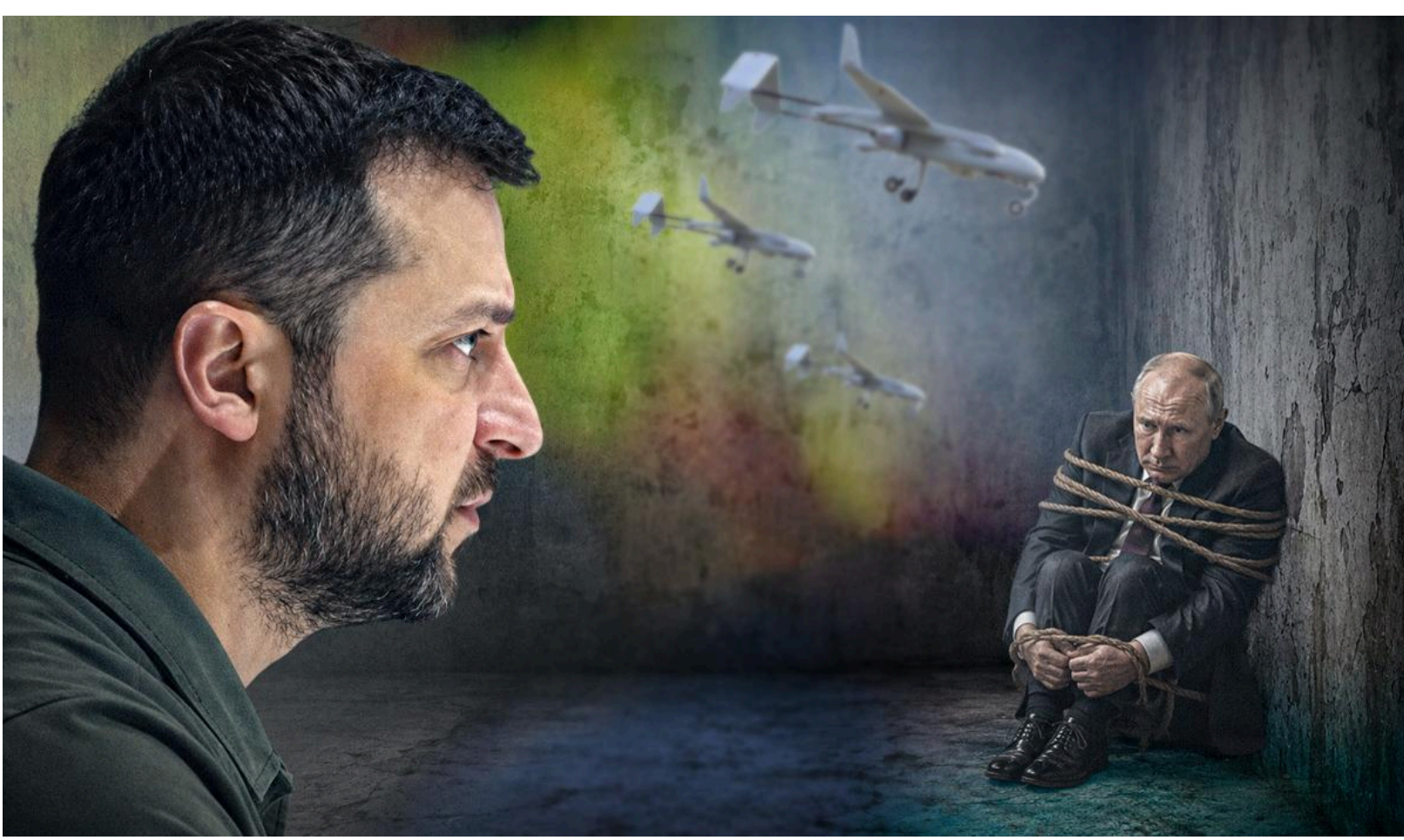
Путін зарва у глухому куті