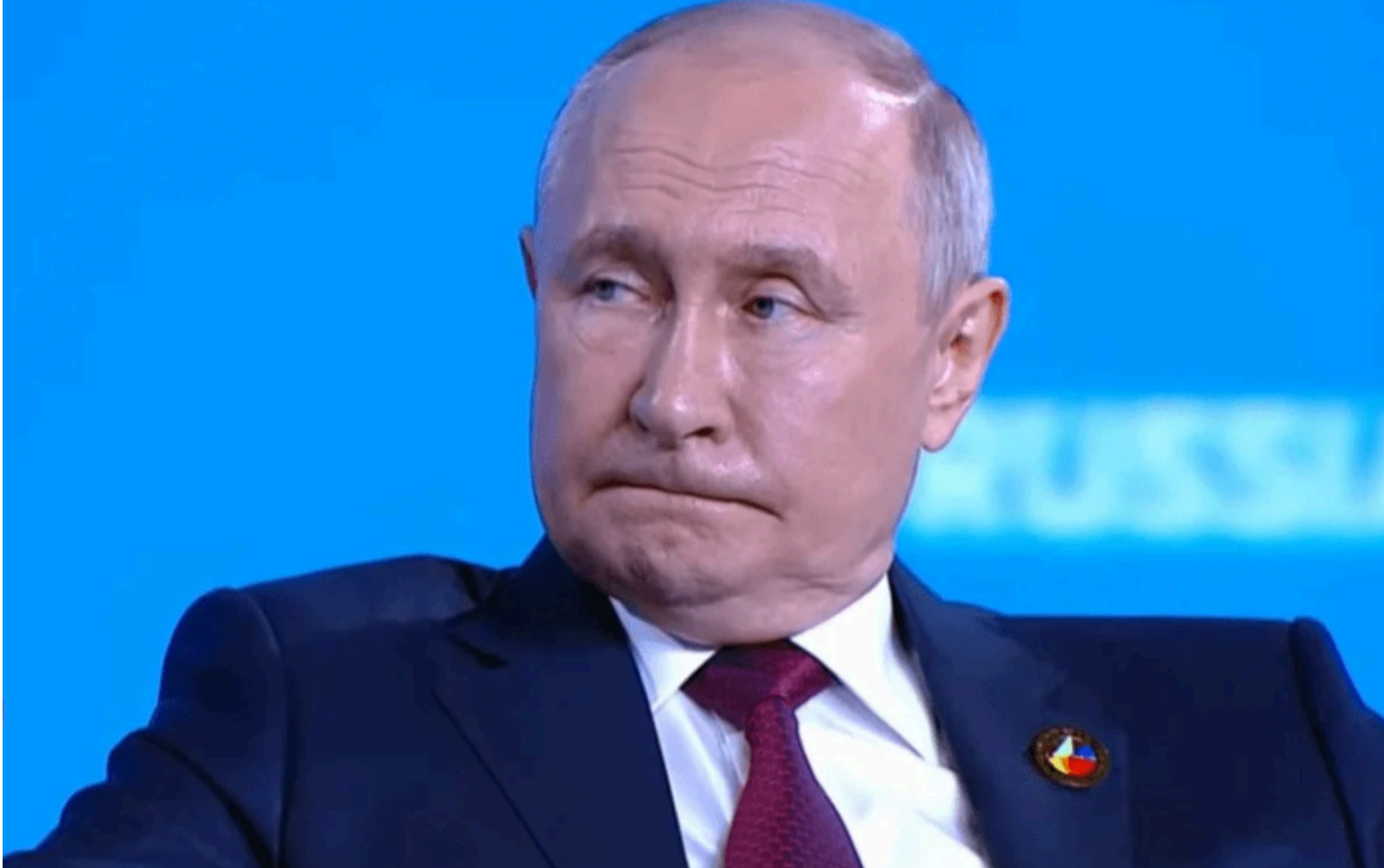
Путін міг би серйозно сприйняти деякі аргументи / скріншот

Якою ж, в такому разі, може бути відповідь Росії?