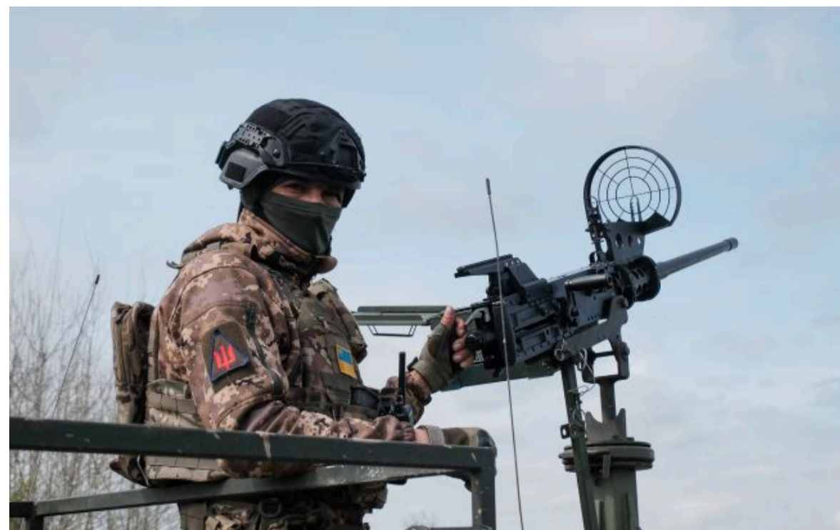
Фото: українська ППО у травні збила майже 92% "Шахедів"

Розумій ситуацію на фронті через факти, а не чутки з РБК-Україна у Google