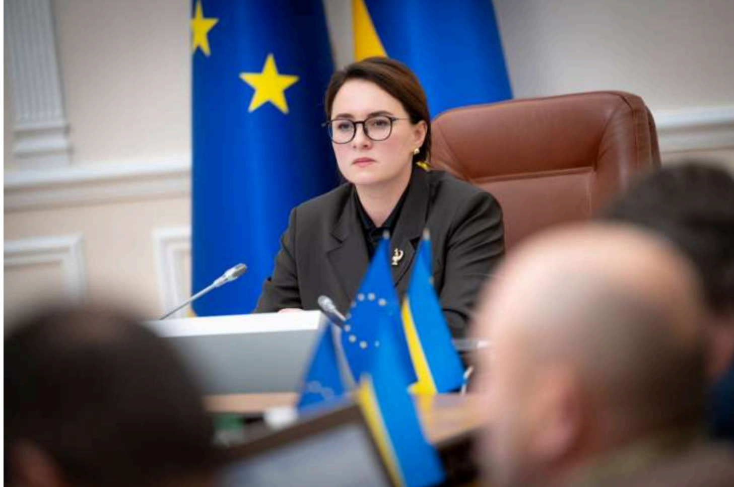
Юлія Свириденко

Кабмін продовжив до кінця 2026 року програму додаткового фінансування медичних закладів, які надають спеціалізовану медичну допомогу на територіях активних бойових дій. Прифронтові лікарні щомісяця отримуватимуть додаткові кошти для формування фонду оплати праці, повідомила прем'єр-міністр України Юлія Свириденко.