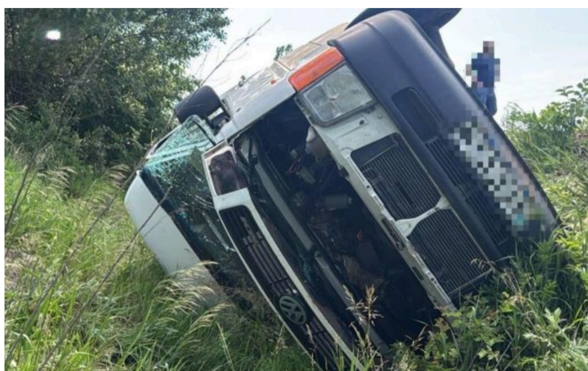
Фото: на Харківщині перекинувся автобус з дітьми та вчителями

Не витрачай час на шум! Читай тільки суть з РБК-Україна у Google