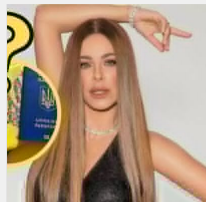
"Прорахувалася, але де?": Росія вказала Ані Лорак на двері ..